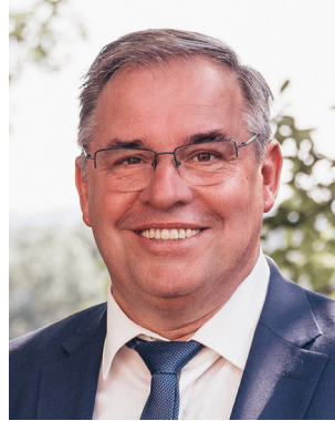
Ihr Bürgermeister Werner Kemetter

Ich wünsche Ihnen ein frohes und gesegnetes Osterfest, einen angenehmen Frühling, alles Gute und bleiben Sie gesund!