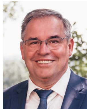
Euer Bürgermeister Werner Kemetter

In diesem Sinne wünsche ich Ihnen allen vom ganzen Herzen erholsame und besinnliche Weihnachten, einen guten Jahreswechsel und ein friedliches, erfolgreiches aber vor allem gesundes neues Jahr 2024.