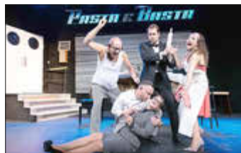
Pasta e Basta, eine turbulente Küchenschlacht mit Hits aus Italien.

Zum Abschluss des aktuellen städtischen Theaterprogramms präsentieren die Hamburger Kammerspiele am Samstag, 8. März 2025, um 20 Uhr im Stadttheater Idar-Oberstein die Produktion „Pasta e Basta“. Einen italienischen Liederabend von Dietmar Löffler mit Livemusik. Unterstützt wird das Theaterprogramm von der Kreis-sparkasse Birkenfeld als Hauptsponsor.