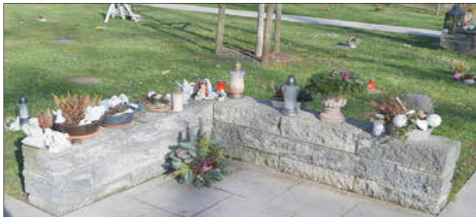
Viele Besucher nutzen mittlerweile die ausgewiesenen Ablagestellen.

Über alle diese Regelungen werden die Besucher auch durch entsprechende Hinweisschilder informiert. Trotzdem müssen die Mitarbeiter immer wieder ordnungswidrig abgelegte Gegenstände entfernen, um ihrer Arbeit nachkommen zu können. Denn auf den Friedhöfen müssen neben den saisonalen Mäharbeiten auch ganzjährig Pflegearbeiten durchgeführt werden. Auch beim Grabaushub für reservierte Ruheparkstellen sind die abgelegten Gegenstände hinderlich. Daher appelliert die Friedhofsverwaltung daran, für die Ablage von Grabschmuck nur die ausgewiesenen Ablagestellen zu nutzen.