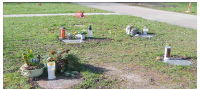
Trotz entsprechender Hinweisschilder werden immer wieder Gestecke und andere Gegenstände auf den Ruhegrabfeldern abgelegt.

Zurzeit stellt die Friedhofsverwaltung wieder vermehrt fest, dass auf den Rasenflächen und Urnengräbern im Bereich der Ruheparks Grabschmuck abgelegt oder aufgestellt wird. Dabei handelt es sich insbesondere um Grablichter, teilweise aber auch um große Gebinde. So verständlich es ist, dass Angehörige ihrer Verstorbenen gedenken: Laut der Friedhofssatzung der Stadt Idar-Oberstein darf auf den Urnengräbern und Rasenflächen der Ruheparks kein Grabschmuck abgelegt werden. Die Friedhofsverwaltung weist darauf hin, dass dies nur an den extra dafür vorgesehenen Ablagestellen erlaubt ist.