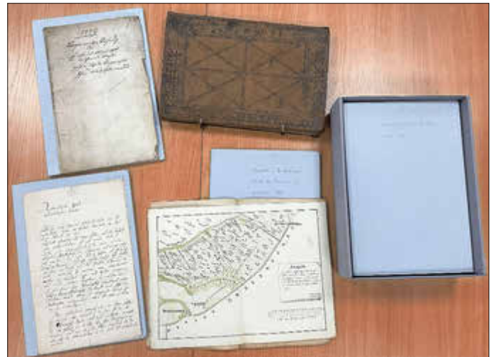
Die Unterlagen aus dem Bestand 2a werden jetzt in speziellen Archivmappen und -schachteln aufbewahrt.

Das im Nahe-Center untergebrachte Stadtarchiv ist das historische Gedächtnis von Idar-Oberstein. Seine Aufgabe ist es unter anderem, die Geschichte und Gegenwart der Stadt in all ihren Facetten dauerhaft zu dokumentieren. Die Bestände stellen damit Archivgut von bleibendem Wert dar und müssen entsprechend geschützt werden.