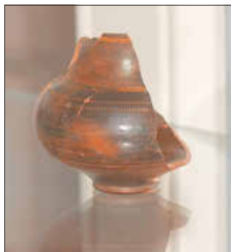
Keramikfund aus römischer Villa bei Ausweiler

Bei den geführten Besuchen im Museum Goldenen Engel müssen sich die Führer bei dem großen Umfang der Ausstellung und der Vielfältigkeit der Themen relativ kurz fassen. Wenn die vorgesehene Zeit von eineinhalb Stunden für eine Führung nicht überzogen werden soll, kann an den einzelnen Stationen nicht auf alle Einzelheiten, interessante Geschichten und oft auch Anekdoten eingegangen werden. Auch hat die Leiterin des Museums, Ingrid Schwerdtner, bei den jahrelangen Recherchen zur Erstellung der Dauerausstellung und auch noch später sehr viele Informationen zusammengetragen, die keinen Platz mehr auf den Tafeln gefunden haben.