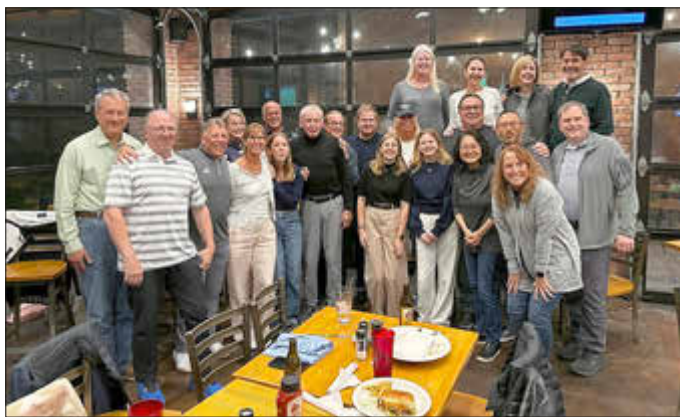
Gruppenbild mit Gastfamilien und Offiziellen der Stadt Delaware beim Abschiedsfest in Bun's Restaurant