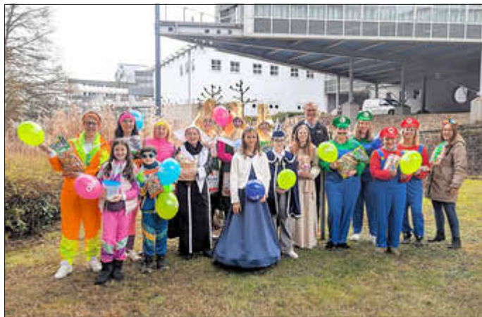
Die Übergabe der OIE Kamelle-Pakete an die Gewinnergruppen 2025

Die Verlosung, die Anfang Februar auf der Facebook-Seite des Energieversorgers „OIE you&amp;me“ gestartet wurde, sorgte für große Begeisterung. Rund 60 Karnevalsgruppen und -vereine aus der Region nahmen mit kreativen Kommentaren und Fotos teil, um sich eines der begehrten Pakete zu sichern.