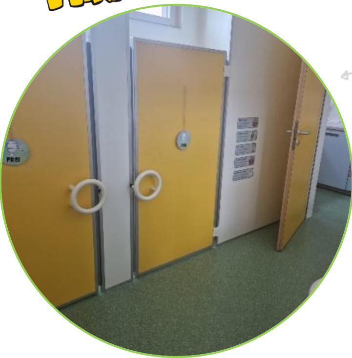
Sanitäranlagen für Kinder mit Wickelbereich