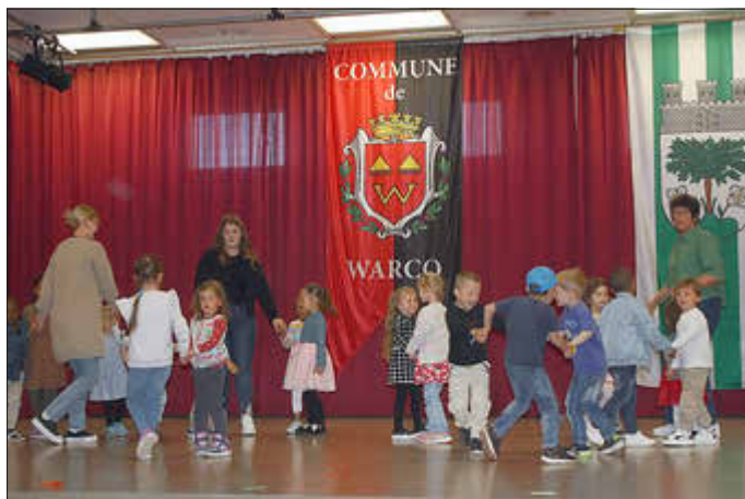
Auftritt des kath. Kindergartens