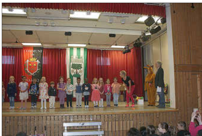
Auftritt des ev. Kindergartens