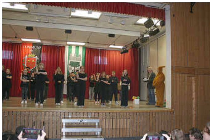
Auftritt der 4. Klassen Grundschule Westrich