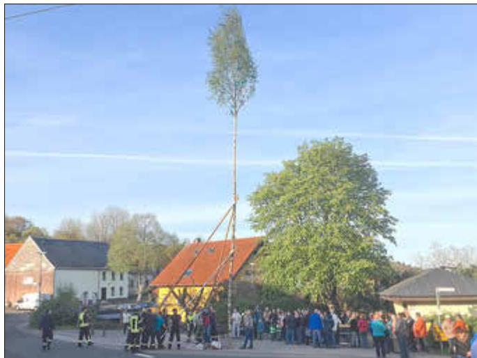
Archivbild vom Maibaumstellen

Am Mittwoch, den 30.04.2025, um 19:00 Uhr stellen wir, traditionell und gemeinsam den Maibaum auf dem Platz an der Bushaltestelle auf. Auch in diesem Jahr wollen wir den Brauch fortsetzen.