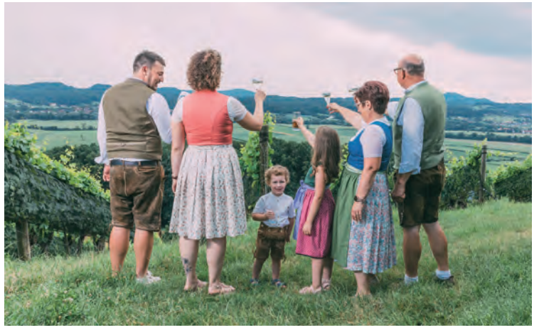
Ausblick und Weine sind beeindruckend und bieten die perfekte Kulisse für die sommerlichen GRILL&CHILL Weinevents. Ganz nahe befindet sich der „Römerstein“, einst keltische Kultstätte, der auch im Logo des Weinguts verewigt ist.