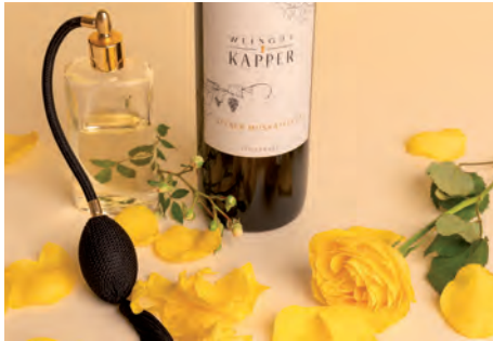
BEZAHLTE ANZEIGE

Von der Verkostung in gemütlicher Kelleratmosphäre bis zum Sommerevent „Grill&Chill“: Machen Sie Urlaub vom Alltag und chillen Sie im Weingarten! Genießen Sie Herzhaftes vom Grill, dazu ein kühles Gläschen Wein, süße Überraschungen, und das alles garniert mit einem grandiosem Ausblick über das Raabtal (Termine r.).