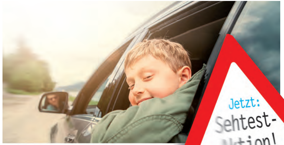
Jetzt zum Sehtest zu Optik Ruck - auch Ihren Liebsten zuliebe.

Ein kostenloser Sehtest bei Optik Ruck trägt zu mehr Sicherheit im Straßenverkehr bei - gleich jetzt einen Termin vereinbaren und sicher in den Urlaub fahren. Sehtesttermine können Sie gleich online vereinbaren unter www.optik-ruck.at oder telefonisch unter 03155/40695.