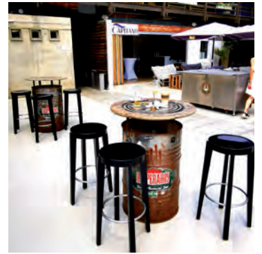
Burger, Cocktails u.v.m. – nach dem Badespaß wartet Erfrischendes in der Strandbar „Capitano“