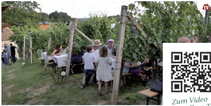
„GRILL on HILL“ im Weingarten am Nussberg in Weinberg/R.