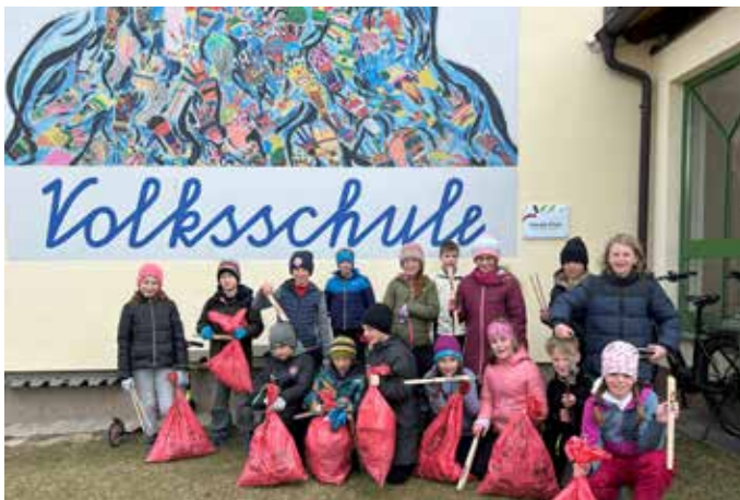
Gemeinsam wurde achtlos weggeworfener Müll gesammelt.

Am 6. Mai kam Familie Rastl an die VS Knoppen und berichtete, was „Schule für Afrika“ mit den Spendengeldern alles ermöglichen konnte. Am 5. Juni fand dann der Benefizlauf „Laufen für Afrika“ im Stadion in Bad Aussee statt. Über 630 Teilnehmer beteiligten sich bei dieser Aktion. Eifrig kämpften unsere Schüler:innen der 3. Schulstufe der VS Bad Mitterndorf um jede Sekunde und jeden Meter beim Lauf. Nach einer Stärkung beim Buffet konnten die Schüler noch spannende Bewegungsstationen besuchen.