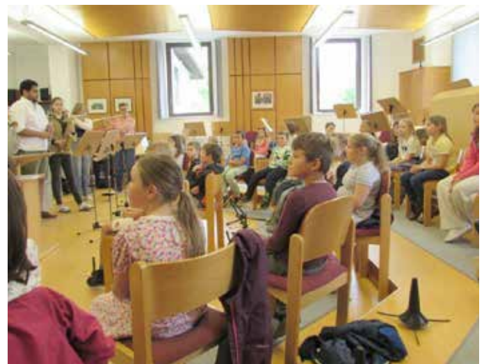
Im Probenraum der MK Kumitz.