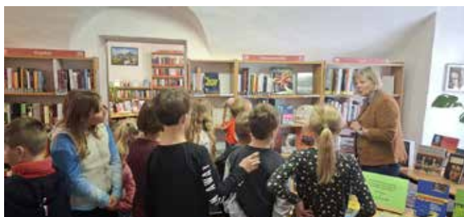
In der Bücherei.

Im Rahmen des Vorlesetages besuchten die 3. und 4. Klasse der VS Knoppen die Bücherei in Bad Aussee. Die Bibliothekarinnen lasen den Kindern vor, erklärten die einzelnen Buch- und Spieleabteilungen und das Ausleihsystem. Es war für uns alle ein toller Vormittag und die Kinder hatten sehr viel Spaß dabei. Weiters lasen die Kinder der Volksschule am 28. März – „Tag des Lesens“ den Kindern des Kindergartens Bilderbücher und eigene kurze Geschichten vor.