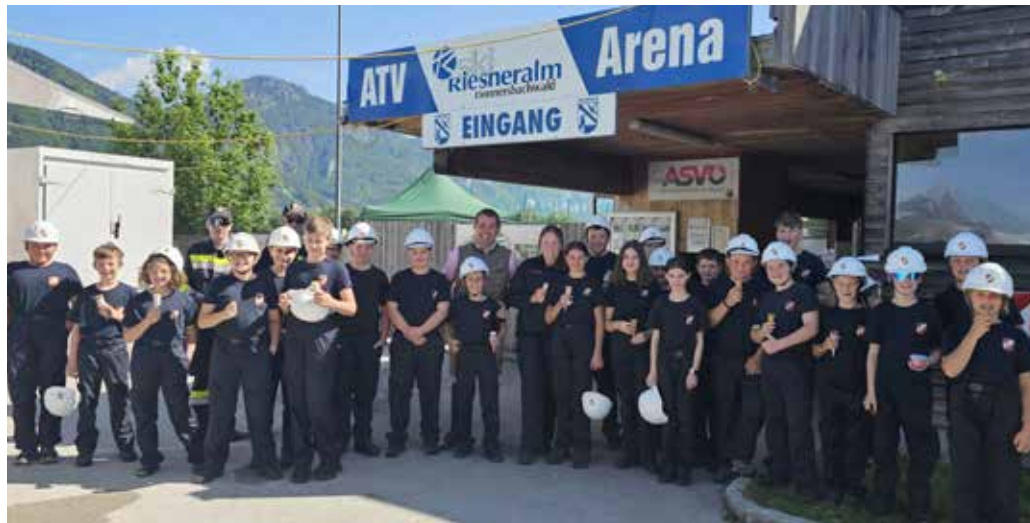
Eine Abkühlung für die jungen Florianis gab's beim Jugendleistungsbewerb in Irnding.