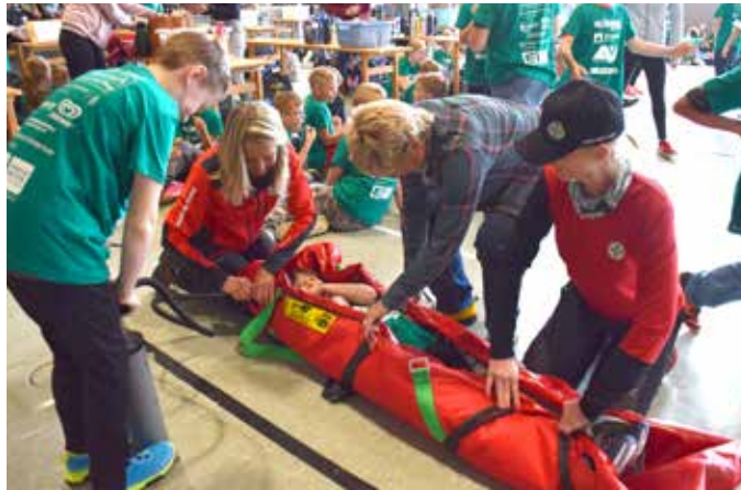
Der Bezirksbewerb der Kindersicherheitsolympiade fand in der Grimminghalle statt.