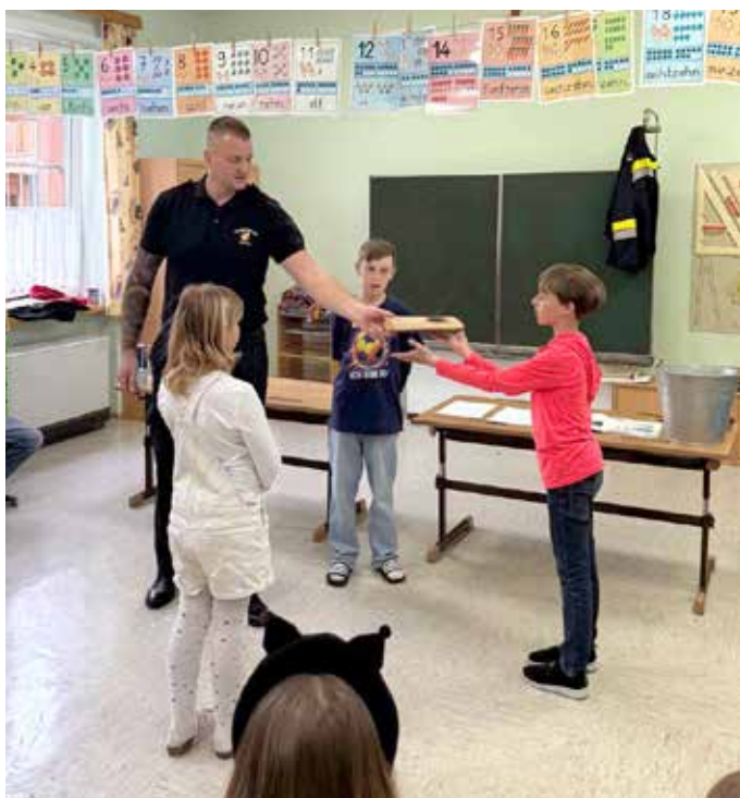
Spannende Experimente wurden durchgeführt.

genommen und es konnte bei dem oder der anderen das Interesse am Dienst in der Feuerwehr geweckt werden. Somit kann diese Veranstaltung auch aus Sicht der Feuerwehr als voller Erfolg gesehen werden und es ist angedacht, derartige Vorträge jährlich zu wiederholen.