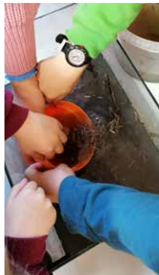
Der erste gemeinsame Tag: Der Laichball wird behutsam ins Aquarium gegeben.

Nadja Rieger, Leitung Kindergarten Pichl-Kainisch