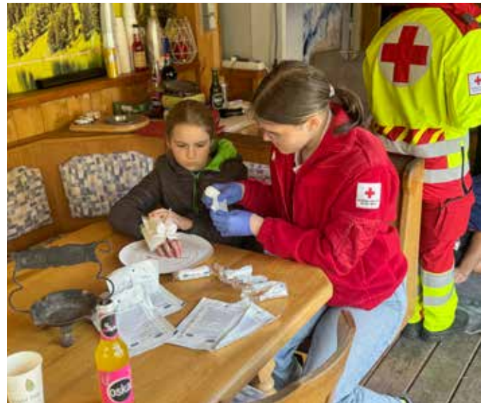
Bei realitätsnahen Szenarien ...

E-Mail: badmitterndorf@st.rotekreuz.at , Telefon: 05 0144 24 030