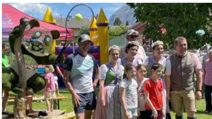
... und auch der Pandabär des Tennisclubs ist preisgekrönt.