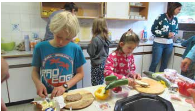
Mit Begeisterung wurde die gesunde Jause zubereitet.

Wie wichtig die richtige Ernährung ist lernen die Kinder schon früh. Mit Spaß schmeckts gleich viel besser. Der Elternverein Knoppen, die Kinder der Volksschule und die Kindergartenkinder bereiteten am 22. Mai gemeinsam eine gesunde Jause vor. Es wurde gerührt, gemixt, geschnitten, gestrichen, verziert, Smoothies hergestellt und vieles mehr. Anschließend wurde im Turnsaal bei festlich gedeckten Tischen und einem wundervollen Buffet die selbstgemachten Speisen verzehrt. Danke dem Elternverein für diesen Einsatz.