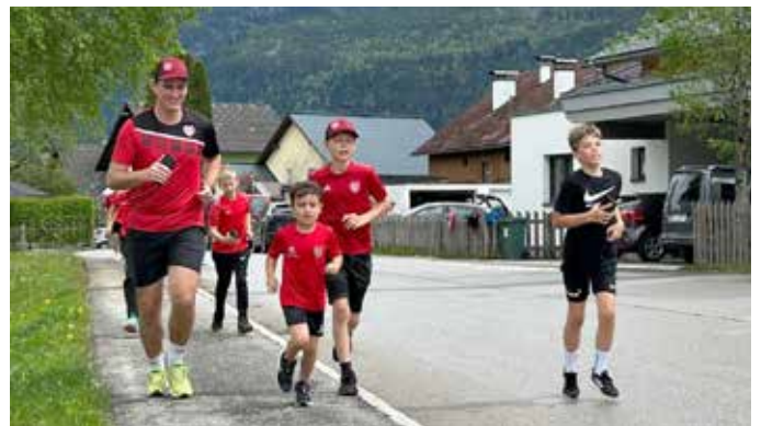
Alt und Jung laufen für jene die es nicht können.