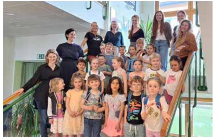
Die Schulanfänger beim Schulluft schnuppern.

Am 2. Juni konnten die Kinder am Vormittag noch einmal Schulluft schnuppern. Bewaffnet mit ihren Schultaschen wurden sie von ihren Eltern zur 1. Stunde in die Schule gebracht und verbrachten 2 Schulstunden mit ihrer zukünftigen Klassenlehrerin. Es wurde gemeinsam mit den zukünftigen Paten (SchülerInnen der kommenden 4. Klasse) und der Klassenlehrerin ein Buch gelesen, in dem es um einen Drachen geht, der immer bunter wird, je mehr er lernt. Außerdem können die Schulanfänger nun einen drachenstarken Jausenspruch und es wurden Schilder gebastelt, damit die Paten und Schulanfänger sich im Herbst gegenseitig wiederfinden! Die Paten haben