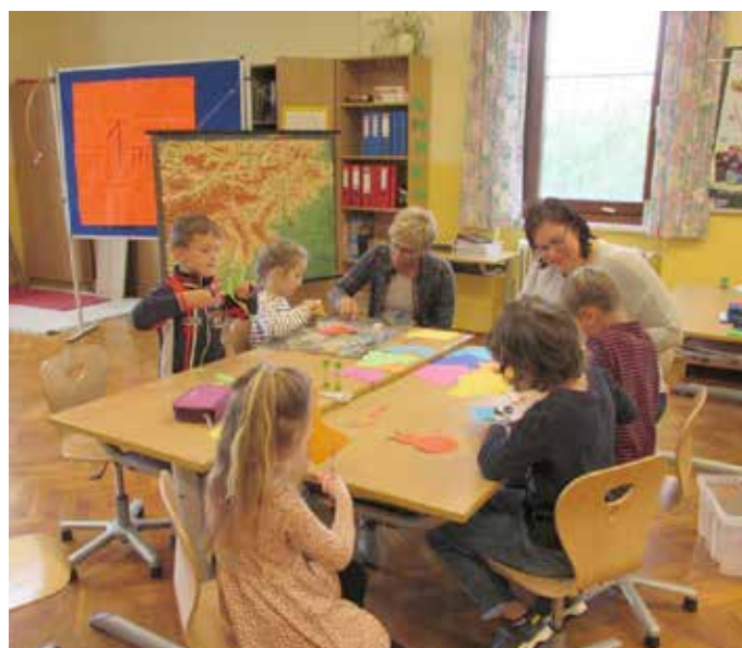
Beim Basteln des Marienkäfers.