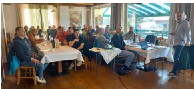
Das neue Kläranlagenportal wird vorgestellt.

Der persönliche Austausch und die fachliche Vernetzung unter den Betreibern spielen dabei eine zentrale Rolle.