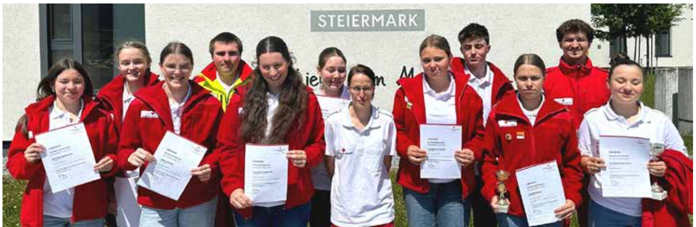
Große Freude über den 3. Platz im Bezirksbewerb.