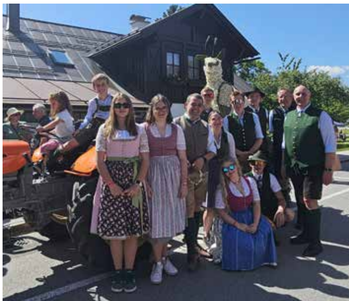
Ein geniales Narzissenfest Wochenende ...