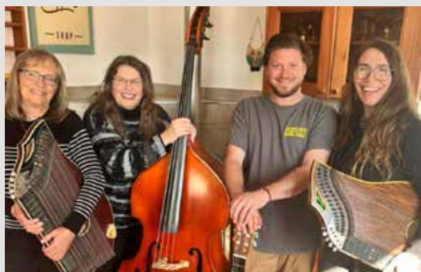
Saitenspiel verzaubert mit vielseitigen Klängen.