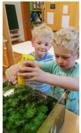
Jeden Tag kümmert sich ein anderes Kind um die Fütterung der Kaulquappen.