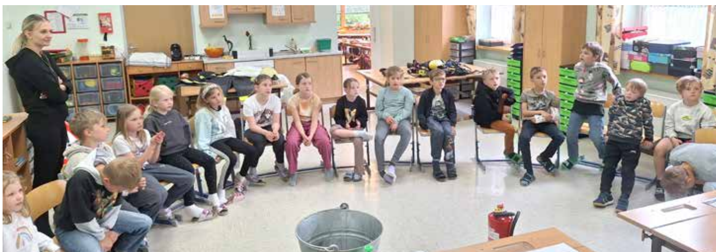
Interessiert lauschten die Kinder.