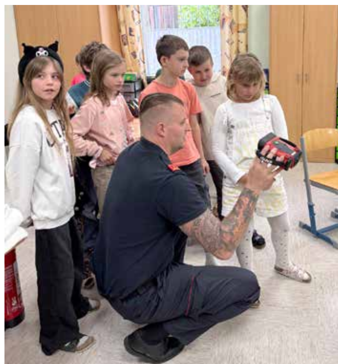
Begutachtung der Ausrüstung