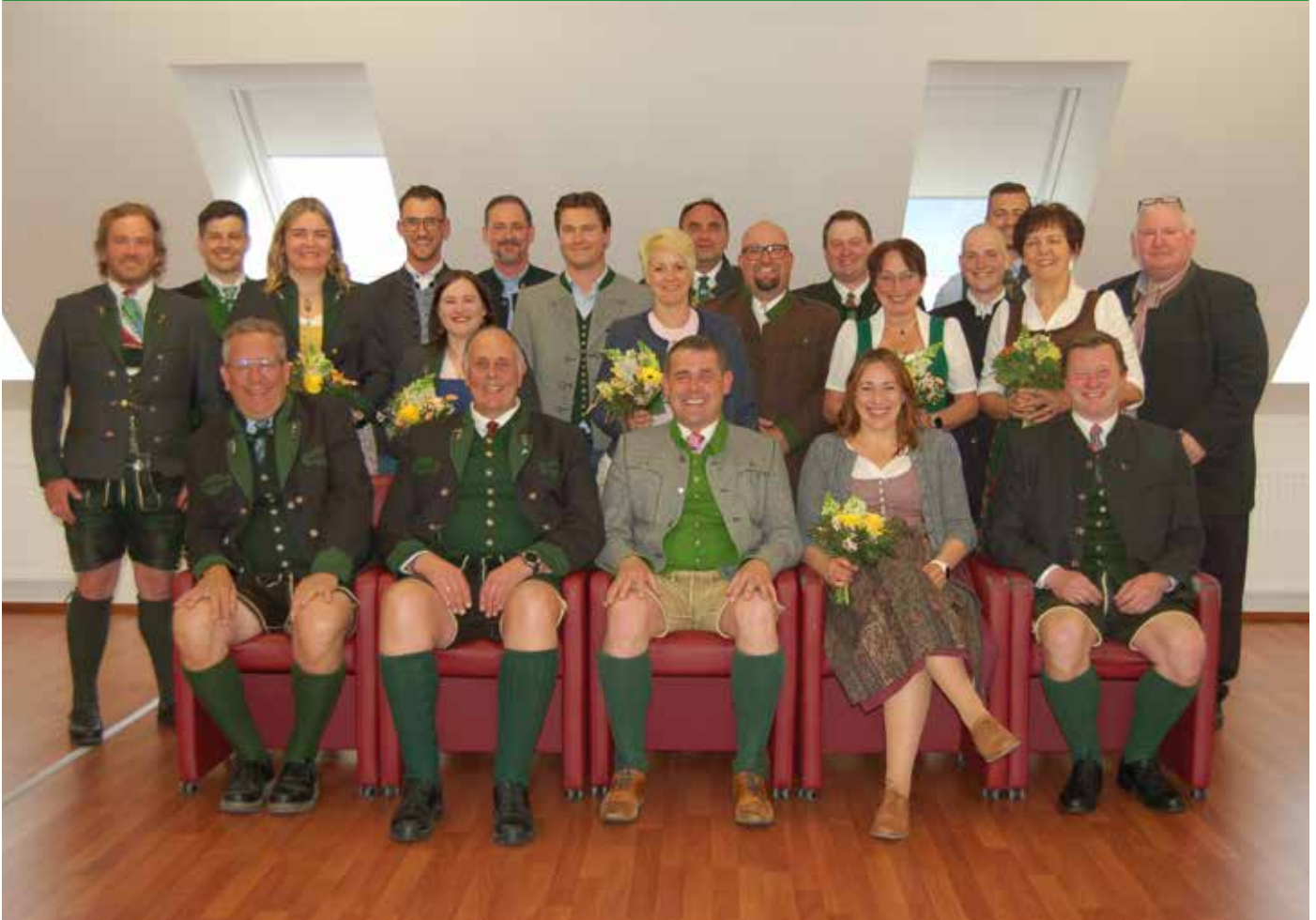
Gemeinsam für Bad Mitterndorf – der neue Gemeinderat