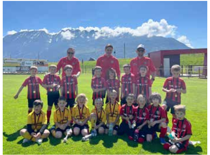
Family Day 2025.

Auch dieses Angebot wurde gut angenommen. Medizinische Erstversorgung ist vor allem beim Sport sehr wichtig, daher haben wir auch in dieser Hinsicht noch einiges vor.