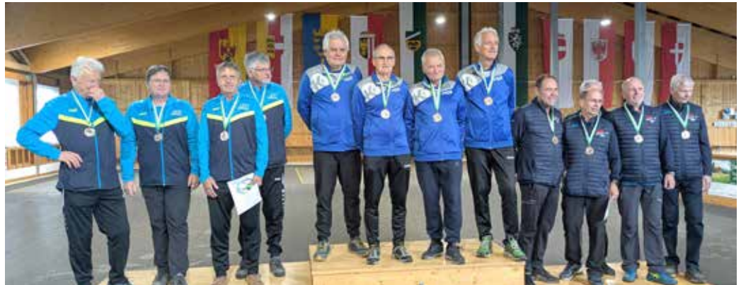
Die glücklichen Sieger.

Für den ESV Bad Mitterndorf gingen drei Ü60 Herrenmannschaften an den Start. Zwei Mannschaften schaff-