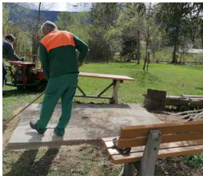
Fleißige Helfer machen den Barfußpark startklar.