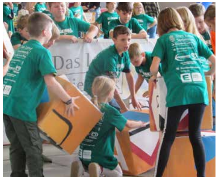
Die VS Knoppen in action.

Die SAFETY-Tour wird jährlich von den Zivilschutzverbänden veranstaltet. Dabei sollen Schülerinnen und Schüler der 3. und 4. Schulstufe lernen, wie man sich richtig in Notsituationen verhält. Praktische Übungen zu Zivil- und Selbstschutzthemen und Spaß sorgen dafür, dass die Kids das erworbene Wissen viel besser im Gedächtnis behalten. Heuer war der Austragungsort die Grimminghalle in Bad Mitterndorf. Es nahmen alle 3 Volksschulen der Gemeinde teil. Die VS Knoppen schaffte es von 18 angetretenen Mannschaften aufs Siegerpodest und erreichte den hervorragenden 2. Platz. Herzlichen Glückwunsch zu dieser tollen Leistung!