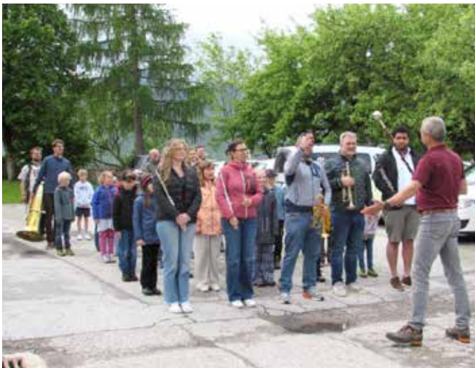
Musik in Bewegung erleben.

im Probenlokal wurden die Instrumente vorgestellt. Anschließend gab es eine gute Jause.