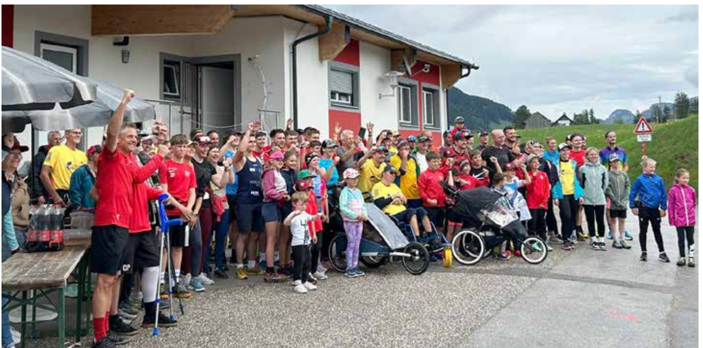
Ein Teil der Läufer des „Wings for Life Run“ 2025.