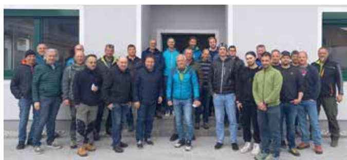
Bei der Besichtigung unserer Kläranlage.