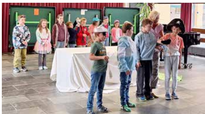
Instrumentenvorführung im Proberaum.