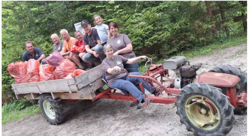
Nach getaner Arbeit ...

Unter Müll, Abfall bzw. Unrat versteht man sämtliche Materialien und Substanzen, welche aus der Sicht desjenigen, der sie loswerden will, keinen unmittelbaren Verwendungszweck mehr erfüllen. Aber leider gibt es viel zu viel davon. Wir von der Berg- und Naturwacht der Ortsstelle Bad Mitterndorf haben auch heuer wieder die Aktion „Saubere Steiermark“ unterstützt, durch unsere Müllsammlung im Bereich des Salza Stausees. Jährlich im Frühjahr, bevor sich die Natur in voller Pracht entfaltet und sämtliche Wildtiere das Licht der Welt erblicken, wird durch diese Aktion jede Menge Müll aus Wiesen, Wäldern, Wegen etc. entfernt. Auf diesem Weg möchte wir uns sehr herzlich bei der Gemeinde Bad Mitterndorf bedanken, welche diese Aktion mit einer guten Jause in der Hubertusalm unterstützte. Petra Hautzinger