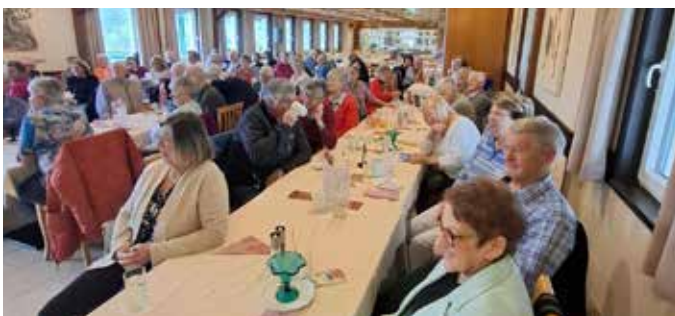
... für die Bad Mitterndorfer Pensionisten.