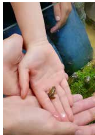
Mit viel Freude und einer Prise Mut dürfen die Frösche am Schluss auf der Hand sitzen.