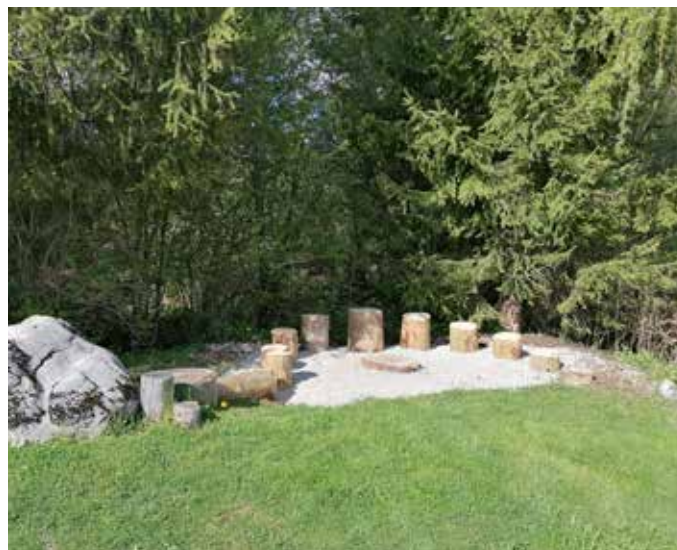
Der neue „Spanische Platz“.