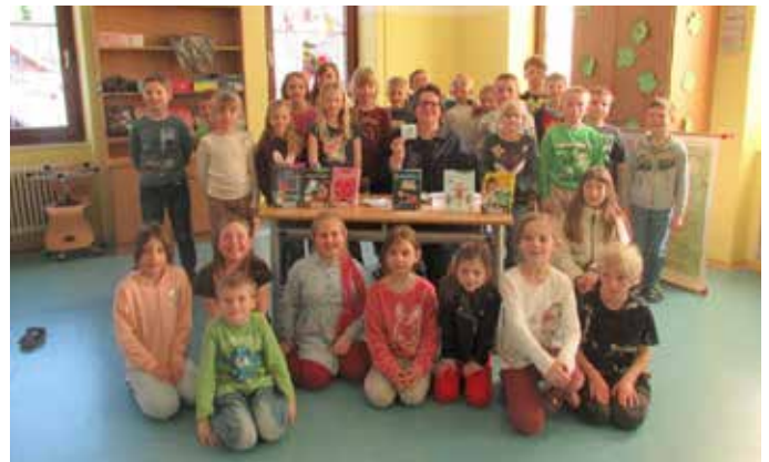
...bringt Freude an den Geschichten.