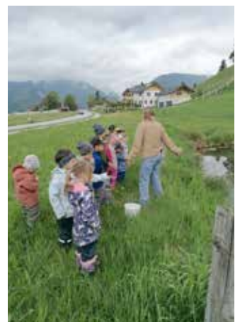
Wir verabschieden uns und wünschen den Fröschen alles Gute.