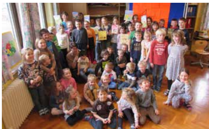
Am Tag des Lesens im Kindergarten.