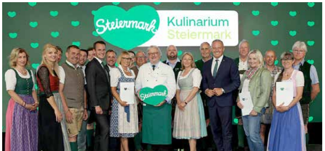
Das Qualitätssiegel „Kulinarium Steiermark“ wurde verliehen. Gratulation an die Bad Mitterndorfer Gastgeber*innen!