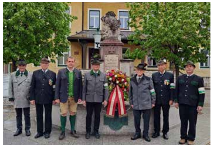
Gedenkranzniederlegung zum Ende des 2. Weltkrieges.