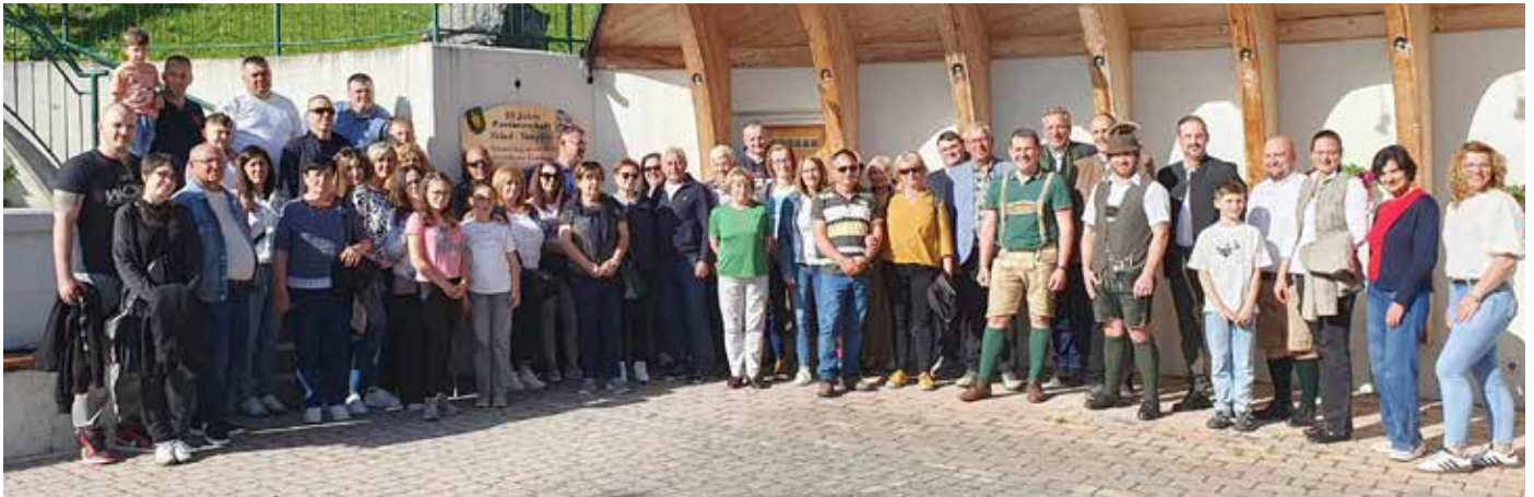
Besuch aus unserer Partnergemeinde Iklad. Eine große Delegation verbrachte schöne Tage in unserer Großgemeinde.