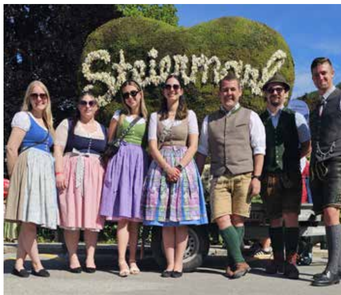
... mit vollem Einsatz unserer Landjugend Gruppen.