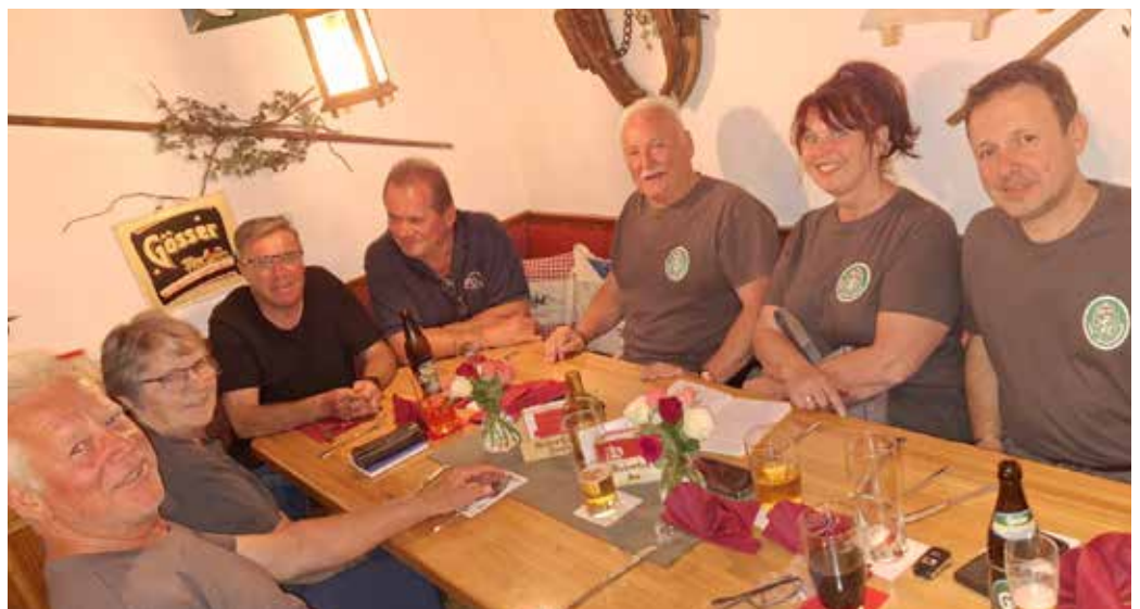
...gibt's die wohlverdiente Jause.