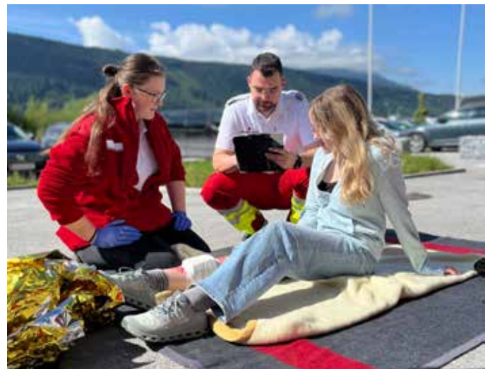
... wurde das Wissen der Jugendlichen getestet.