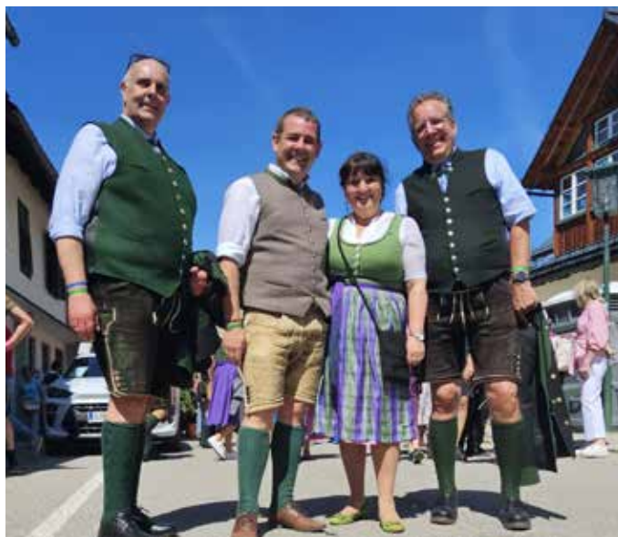
... und politischer Austausch beim Rundgang durch Altaussee.