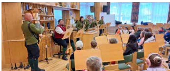
Instrumentenvorführung im Proberaum.