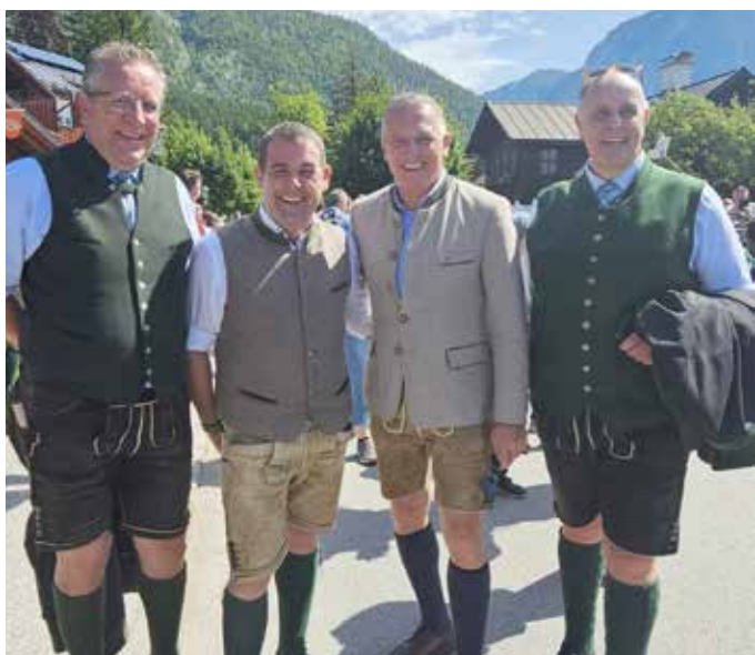
Zusammentreffen mit der Steirischen Landesspitze ...