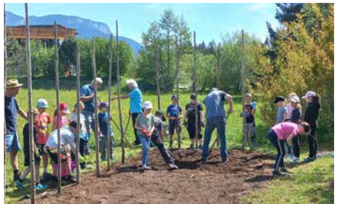
Beim gemeinsamen Gemüseanbau.

Ein herzliches Dankeschön gilt der Gärtnerei Maierhofer für die Pflanzen, die zur Verfügung gestellt wurden und vor allem unseren Einachserfreunden, die den Acker vorbereiteten, die Samen und Gartenwerkzeuge zur Verfügung stellten, den Kindern fachkundige und praktische Tipps gaben und bei der Pflege und Bewässerung weiterhin Hilfe leisten.