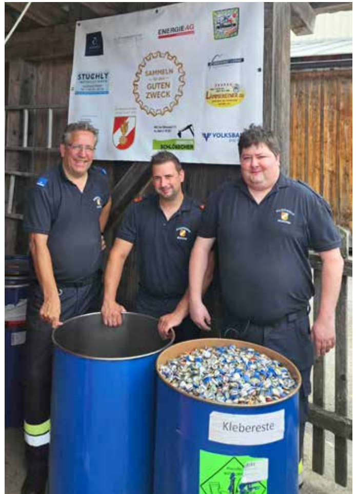
HBI, OBI und Kassier der FF Neuhofen.

Die Freiwillige Feuerwehr Neuhofen und die beteiligten Bad Mitterndorfer Unternehmen danken im Voraus für die rege Teilnahme und Unterstützung.