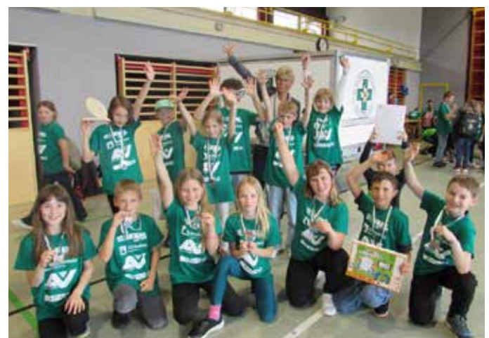
Freude über den 2. Platz.