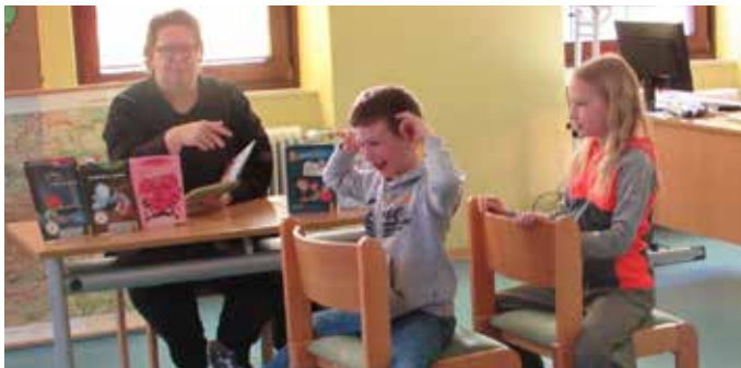
Eine Lesung in der Schule...

Ammerer las nicht nur Geschichten über Till vor, sondern die Kinder wurden auch zum Mitmachen aufgefordert. Dies machte ihnen besonders viel Spaß. Zum Schluss ließ sie uns noch ein paar Exemplare ihrer Bücher für unsere Schulbücherei da.