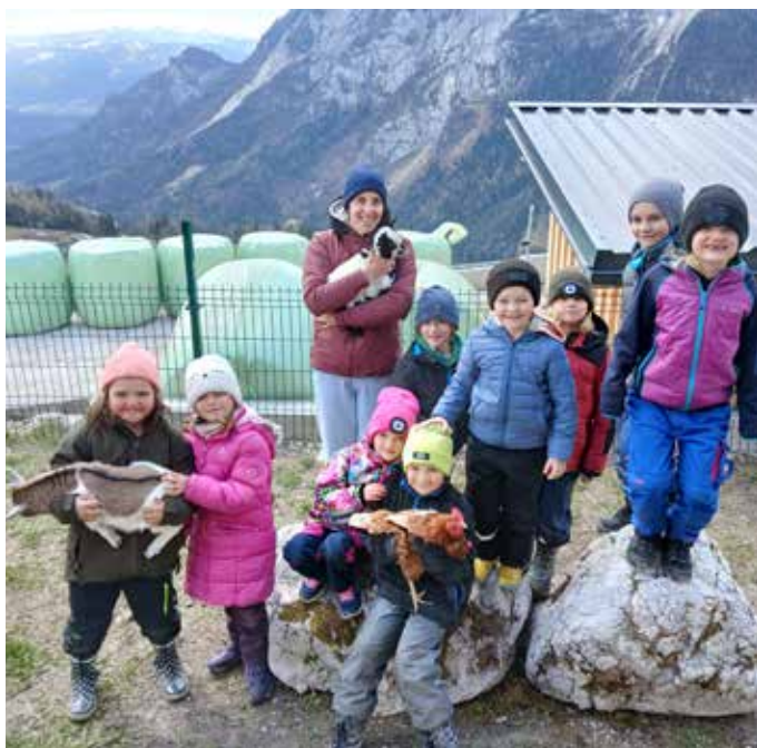
Viel Spaß beim Ausflug auf den Bauernhof.