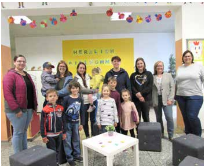
Die Freude der Schulanfänger war groß.

Am 5. Mai schnupperten die künftigen Schulanfänger*-innen erstmals echte Klassenzimmerluft. Mit viel Neugier, Freude und Stolz wurde ein Gedicht gelernt, ein Marienkäfer gebastelt und sogar das erste Arbeitsblatt gemeistert. Bei einer gemütlichen Jause klang der besondere Nachmittag aus – ein gelungener Start in ein neues Kapitel!