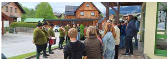
Vorbereitung auf die Marschformation.