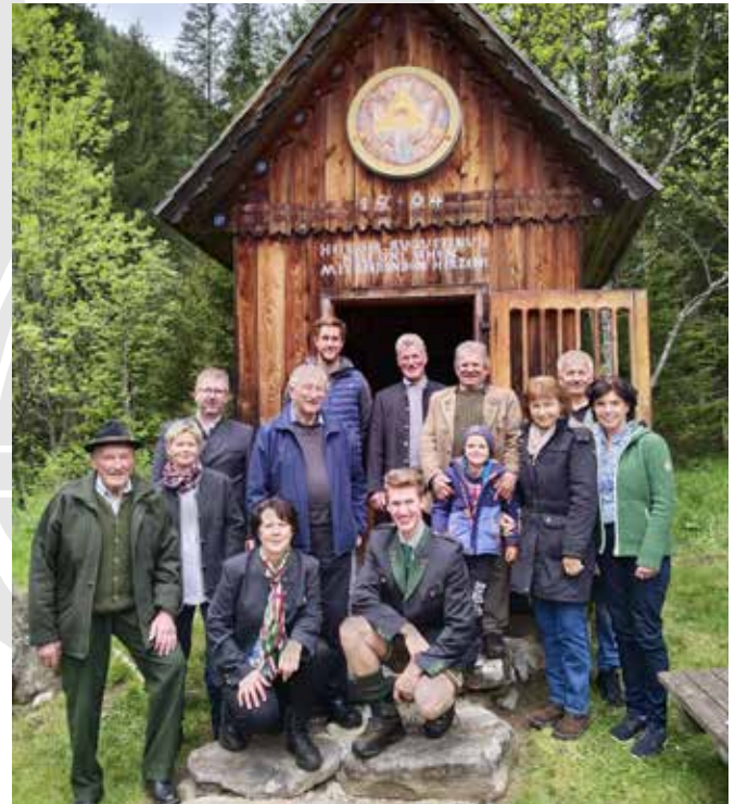
Anlässlich „60+1 Jahre Augustinerkreuz“ wurde mit der Landjugend und den Katscher Bauern ein Jubiläumsfest mit Hl. Messe gefeiert.

Bei gemütlichem Beisammensein und kulinarischer Stärkung klang ein sehr gelungenes und von der Landjugend bzw. den Katscher Bauern organisiertes Fest aus.