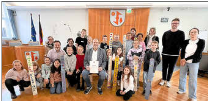
Die Grundschule Götttschied übergab Oberbürgermeister Frank Frühauf eine Demokratiebank und einen Zaun der Kinderrechte.

Schülerinnen und Schüler der Grundschule Götttschied überreichten kürzlich eine Demokratiebank und einen Zaun der Kinderrechte an Oberbürgermeister Frank Frühauf. Die GS Götttschied ist Modellschule für Partizipation und Demokratie sowie Europaschule und hat schon mehrmals die Eröffnung des landesweiten Demokratie-Tages mitgestaltet. Im vergangenen Jahr wurde in Idar-Oberstein eine Town-Hall ‚Schule der Zukunft‘ ausgerichtet.