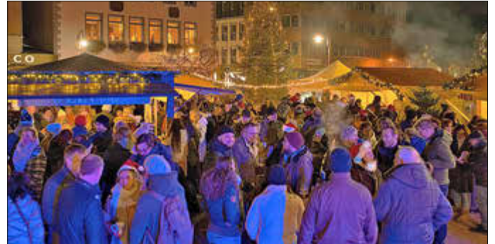
Die Premiere des Adventsglühens im vergangenen Jahr kam gut an.

Das Abenteuer beginnt am Donnerstag, 11. Dezember, um 17 Uhr mit einer feierlichen Eröffnung durch Oberbürgermeister Frank Fröhlich und der städtischen Wirtschaftsförderung. Im Anschluss sorgt der bekannte DJ KFR alias Flo Reidenbach für die perfekte musikalische Untermalung, um die Gäste in die vorweihnachtliche Stimmung zu versetzen. Eine hervorragende Gelegenheit, bei einem „Winter After Work“ mit Kolleginnen und Kollegen die festliche Zeit einzuläuten.