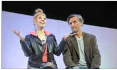
Die quirlige Journalistin Lea und der angepasste Lehrer Livius machen sich gemeinsam auf einen Roadtrip.

Als nächste Aufführung im Rahmen des städtischen Theaterprogramms präsentiert das Thespiskarren Tournee-Theater am Samstag, 22.11.2025, um 20:00 Uhr im Stadttheater Idar-Oberstein das Stück „Der erste letzte Tag“. Das Schauspiel nach dem Roman von Sebastian Fitzek ist eine turbulente, warmherzige Geschichte über Mut, Wahrheit, Freundschaft – und darüber, wie ein einziger Tag alles verändern kann.