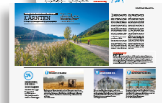
Muster 2/1 Seite