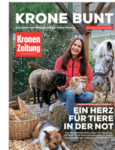
Muster 1/1 Seite

Sollten es für diese Maßnahme nicht genügend Anmeldungen zustande kommen, behält sich der Tourismusverband Erzberg-Leoben das Recht vor, diese abzusagen. Änderungen vorbehalten.