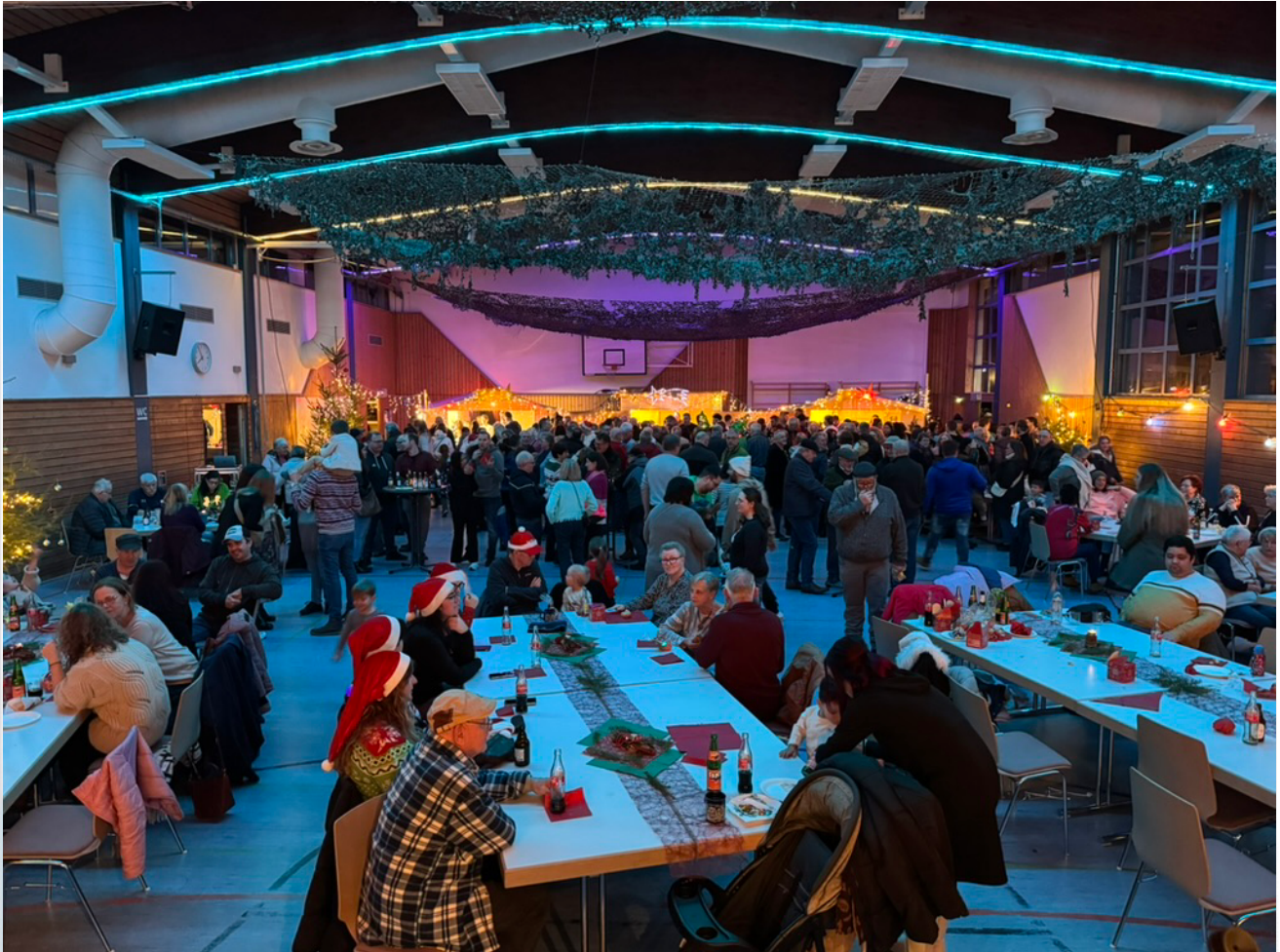
Viele Gäste hatten sich in der Dr. Darge Halle für den singenden klingenden Weihnachtsbaum eingefunden