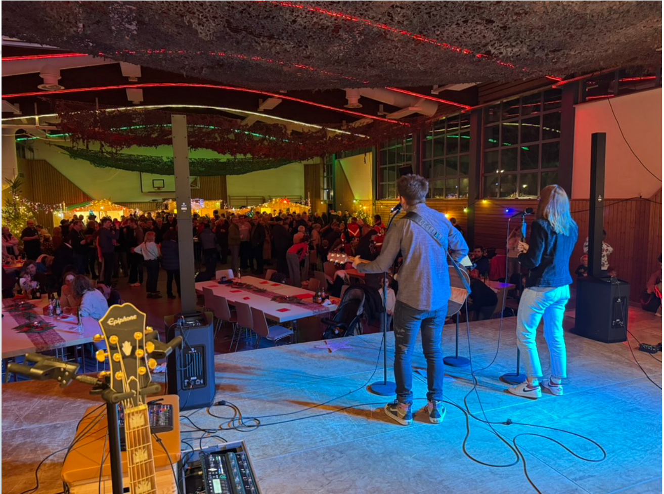
L & L Acoustics, die mit ihrem Auftritt wieder für entsprechende Stimmung sorgen