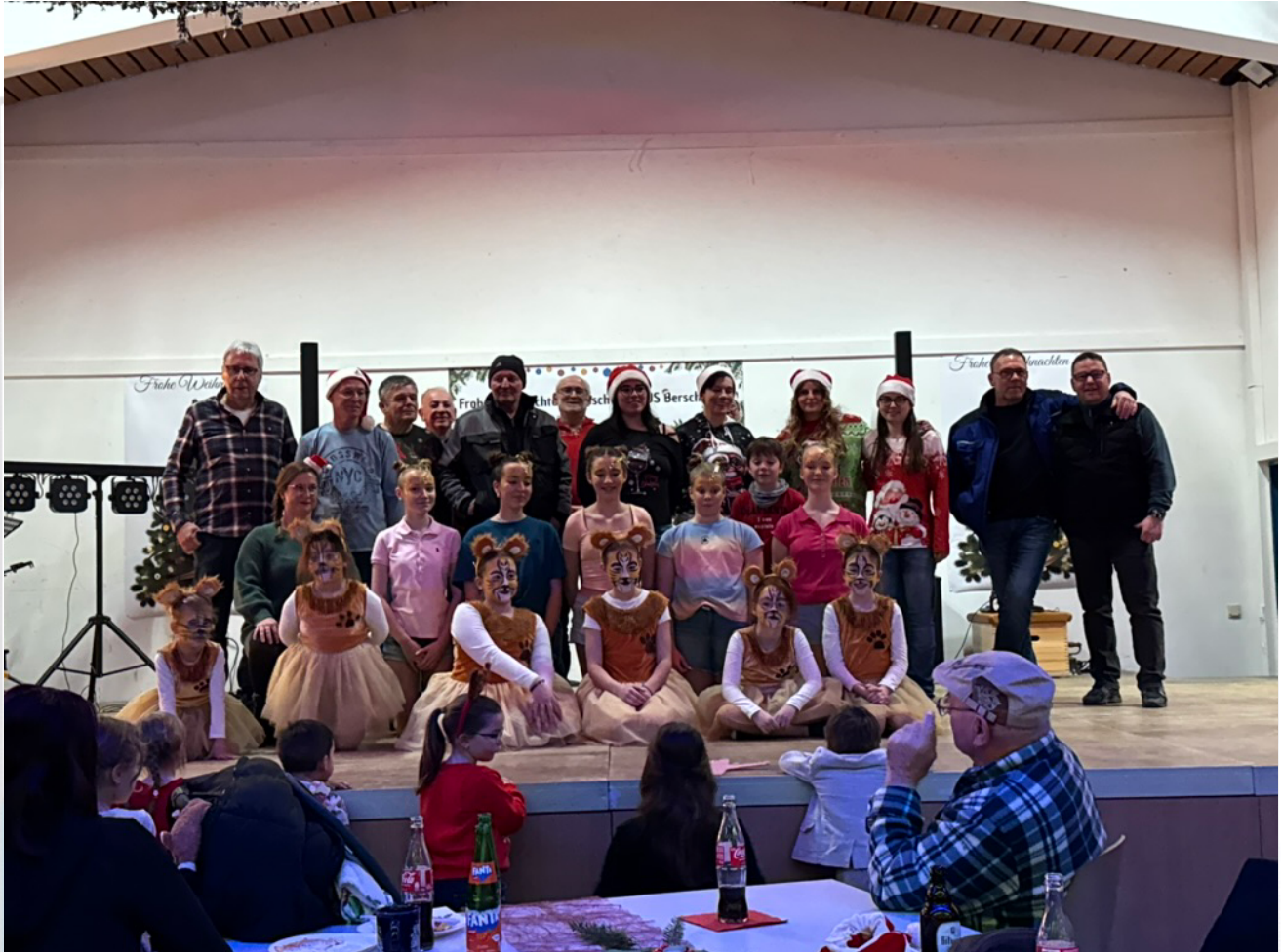
Die Akteure aus dem ersten Teil des Programms