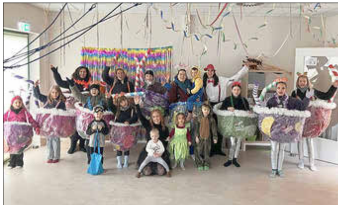
Bunt kostümiert besuchte die Reelser Faschingsgruppe die städtische Kita.

Für fast alle Kinder ist Fasching eine aufregende Zeit: Einmal schön sein wie eine Prinzessin, mutig wie ein Superheld oder Feuerwehrmann, wild wie ein Dinosaurier oder Drache. Verkleiden und schminken, in eine andere Rolle schlüpfen, tanzen und spielen, toben und Spaß haben – all das macht das Faschingsfest in der Kita Regulshausen zu etwas ganz Besonderem. Die närrischen Aktivitäten stärken das Miteinander, fördern das Gefühl der Zugehörigkeit und das gemeinsame Erleben von Freude und Ausgelassenheit.