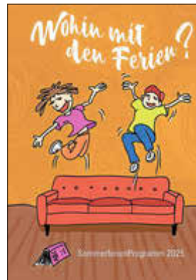
Titelseite des letztjährigen Programmheftes.