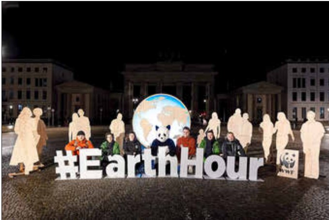
Im Jahr 2025 nahmen in Deutschland über 500 Städte an der Earth Hour des WWF teil.

Die Stadt Idar-Oberstein folgt auch in diesem Jahr wieder dem Aufruf der Umweltstiftung WWF Deutschland und beteiligt sich an der ‚Earth Hour‘. Sie setzt damit ein sichtbares Zeichen für Klimaschutz und gesellschaftlichen Zusammenhalt.