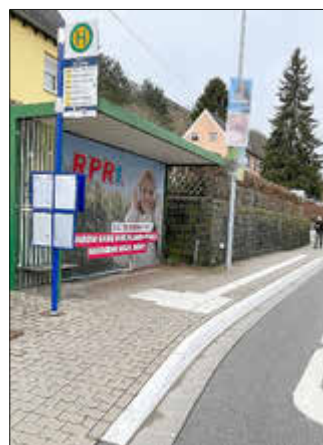
Diese Bushaltestelle ist bereits barrierefrei ausgestattet.

Am Montag, haben die Arbeiten zum barrierefreien Umbau weiterer Bushaltestellen im Stadtgebiet begonnen. Dabei werden die Haltestellen unter anderem mit erhöhten Bordsteinen und taktilen Leitsystemen ausgestattet.