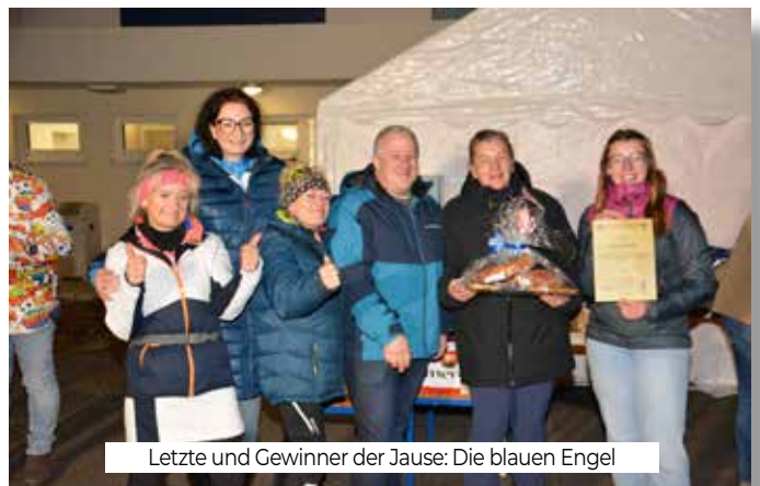
Letzte und Gewinner der Jause: Die blauen Engel