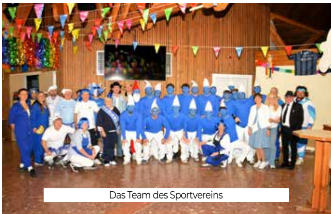
Das Team des Sportvereins