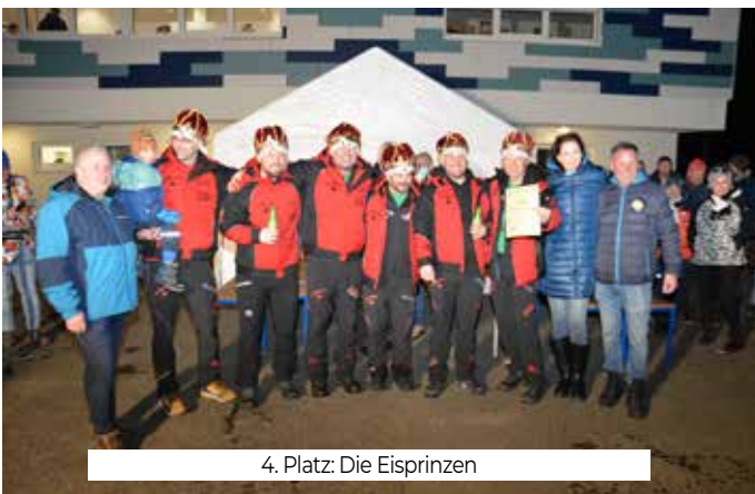
4. Platz: Die Eisprinzen