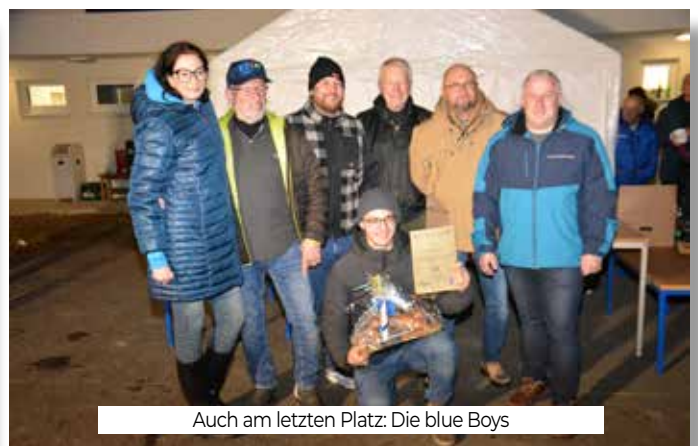
Auch am letzten Platz: Die blue Boys