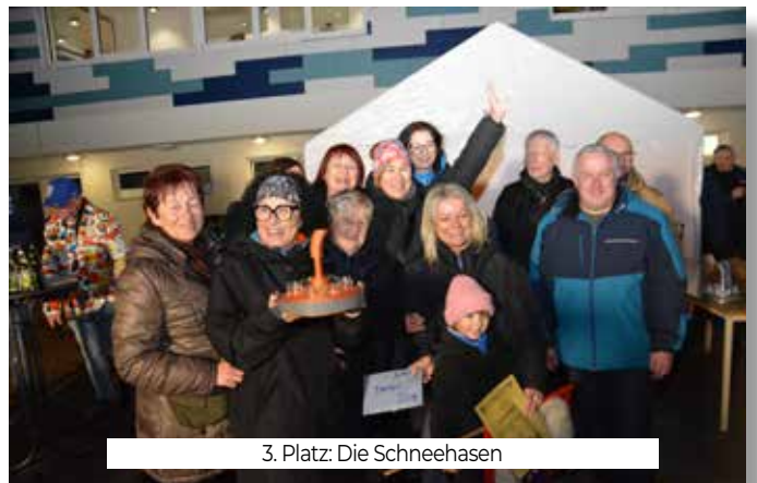
3. Platz: Die Schneehasen