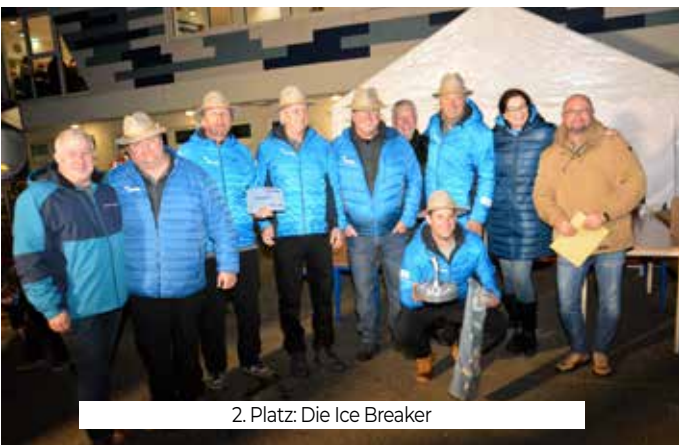
2. Platz: Die Ice Breaker