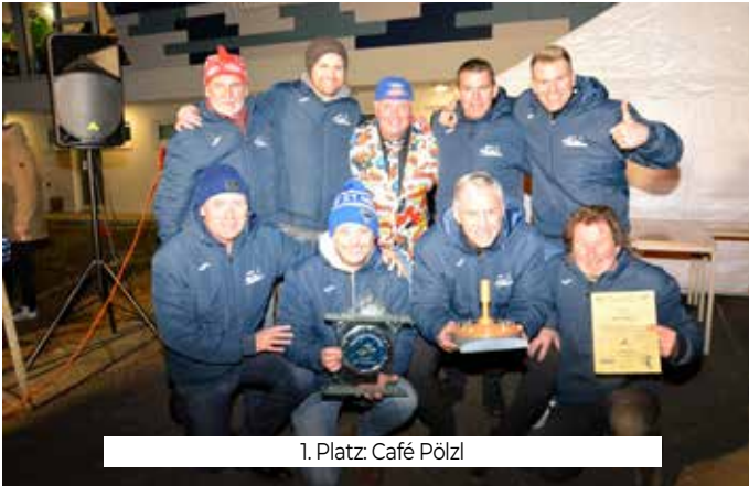
1. Platz: Café Pölzl