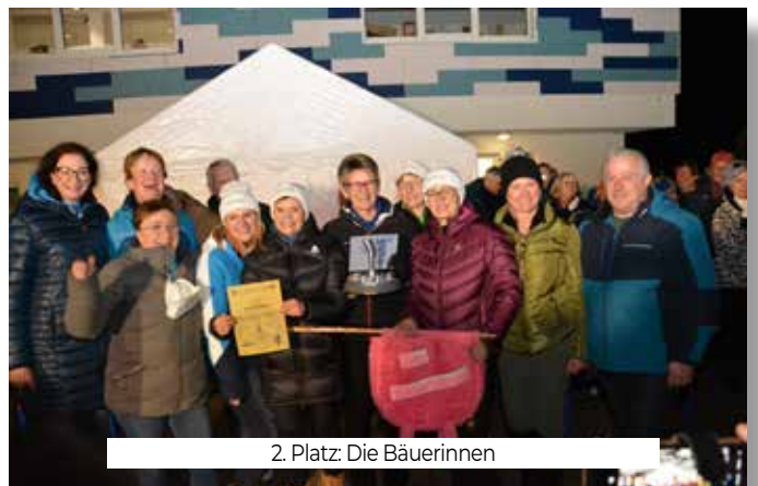
2. Platz: Die Bäuerinnen