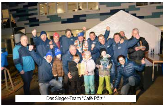
Das Sieger-Team "Café Pölzl"