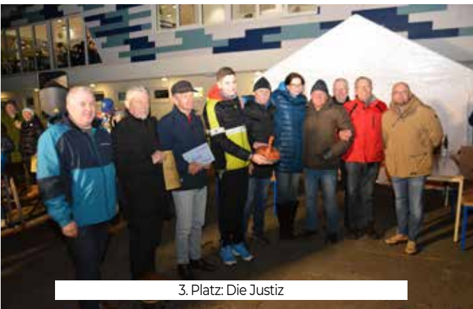
3. Platz: Die Justiz