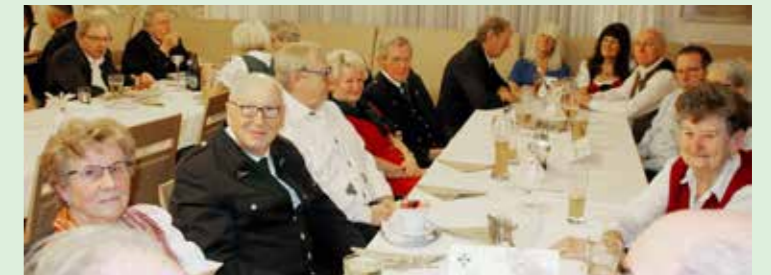
Blick auf den Tisch mit den Wildoner Ballbesuchern