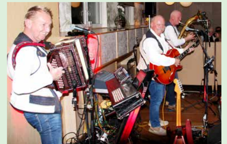
Das Radlpasstrio sorgte zum wiederholten Mal für beste Stimmung