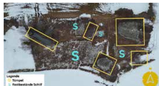
Tümpelansicht aus der Luft (Anton Hlebaina)

Als Umsetzungsbeispiel kann Krakaudorf genannt werden: Eine verlandete Fläche wurde durch neu angelegte Tümpel wieder zu einem artenreichen Lebensraum entwickelt – ein sichtbares Zeichen dafür, wie regionale Zusammenarbeit Natur stärkt.