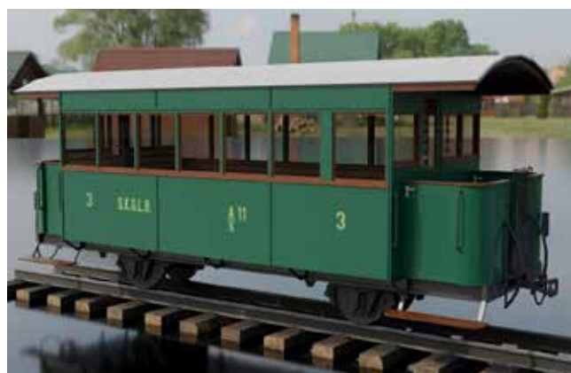
So soll er künftig aussehen. Ein Modell des Barwagens A11. Erstellt vom Club 760