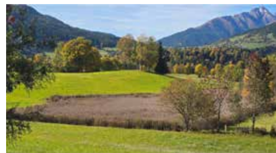
Ausblick auf die Feuchtfläche vor der Renaturierung (ARGE natur & land)

Wer in der Region Murau Murtal selbst einen Tümpel, Blühstreifen oder eine andere Biotopmaßnahme anlegen möchte, kann sich für fachliche, organisatorische und finanzielle Unterstützung an das Regionalmanagement Murau Murtal wenden. Gemeinsam schaffen wir neue Lebensräume für unsere Region – sichtbar, nachhaltig und mit direktem Mehrwert für Mensch und Natur.