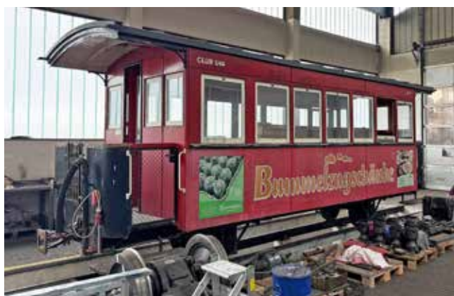
Sie sieht er jetzt aus. Der Barwagen A11 in der Werkstätte Murau vor der Aufarbeitung.

Zu Saisonbeginn Ende Juni soll er ab Mauterndorf eingesetzt werden, nun in Dunkelgrün, passend zur vereinseigenen Garnitur der legendären Ischlerbahn.