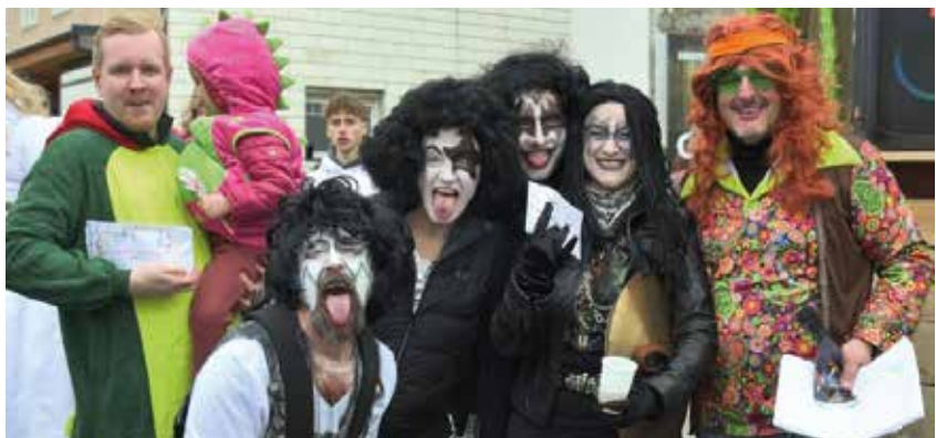
3. Preis Kleingruppen: „Beschwörer-Kiss“.