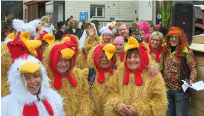
1. Preis Kleingruppen: „Pölstaler Hühner“.

Heuer nahmen besonders viele Gruppen, Kleingruppen und Einzelmasken teil. Die Kreativität und der Ideenreichtum der Akteurinnen und Akteure sorgten für beste Unterhaltung und ausgelassene Stimmung entlang der gesamten Strecke. Zahlreiche Zuschauerinnen und Zuschauer säumten die Straßen und feuerten die fantasievoll kostümierten Teilnehmer begeistert an. Musikalisch begleitet wurde der Umzug