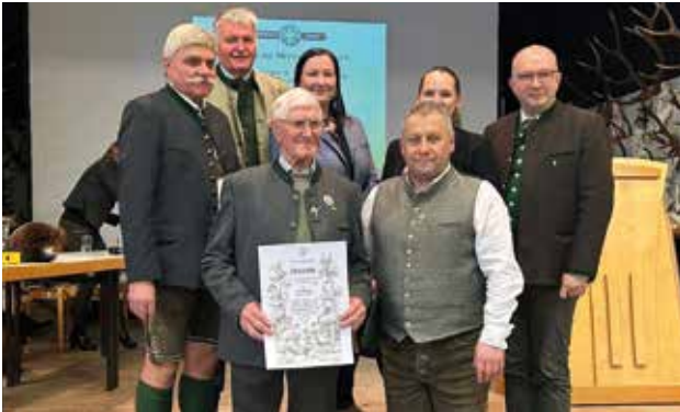
70 Jahre Mitgliedschaft