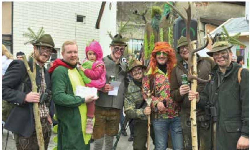
2. Preis Kleingruppen: „Wilderer“.