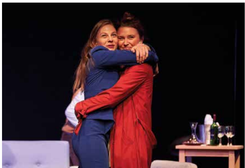
THEO-Killed my Ex

Kontakt: Theater Oberzeiring, Hauptstraße 7a, 8762 Oberzeiring Tel: 03571/20043 | Tel. 0664/8347407 info@theo.at | www.theo.at