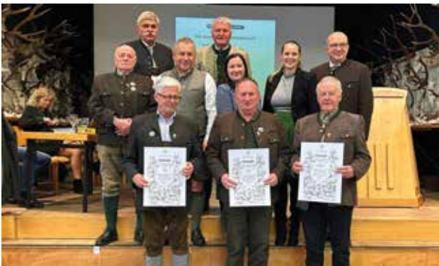
50 Jahre Mitgliedschaft