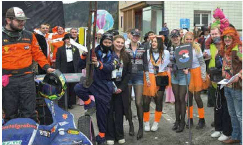
1. Preis Großgruppen: „Racing Team Leban“.

Ein absolutes Highlight des gesamten Faschingsumzuges war jedoch der Sieger bei den Großgruppen: Das „Formel 1 Rennwagen Team Leban“. Mit einem beeindruckend detailgetreu nachgebauten Rennwagen, zahlreichen technischen Raffinessen und einem perfekt abgestimmten Teamauftritt sorgte diese Gruppe für staunende Gesichter entlang der gesamten Strecke. Der aufwendig gestaltete Rennbolide war nicht nur ein echter Blickfang, sondern zeugte auch von enormem handwerklichem Geschick, großem Zeitaufwand und außergewöhnlichem Engagement. Dieses Projekt war spürbar mit viel Herzblut umgesetzt worden und stellte zweifellos einen der spektakulärsten Beiträge des diesjährigen Umzuges dar. Der tosende Applaus des Publikums bestätigte die verdiente Auszeichnung eindrucksvoll.