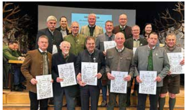
40 Jahre Mitgliedschaft