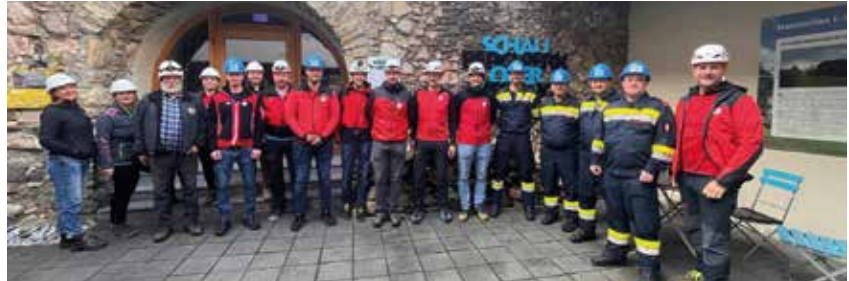
Sicherheitsbefahrung mit Bergrettung Pöls und FF Oberzeiring

Zusammen mit der Bergrettung Pöls, der Freiwilligen Feuerwehr Oberzeiring und dem Verein Schaubergwerk Museum Oberzeiring hatten wir eine gemeinsame Sicherheitsbefahrung im Bergwerk.