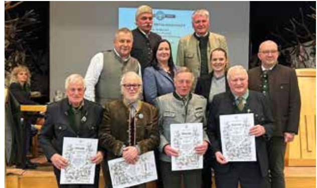
60 Jahre Mitgliedschaft