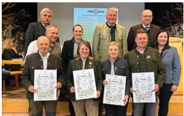
25 Jahre Mitgliedschaft

Landtagsabgeordneter Bruno Aschenbrenner informierte über aktuelle jagdfachliche Themen auf Landesebene. Im Zuge der kommenden Novellierung des Jagdgesetzes soll insbesondere die Entnahme sämtlicher Prädatoren erleichtert werden; die entsprechenden Verhandlungen befinden sich bereits in der finalen Phase.