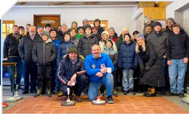
Traditionelles Familienduell in der Stocksporthalle des ESV Jahring.

Ein herzliches Danke geht an die ehrenamtlichen Schilehrer, Organisatoren und an alle, die tatkräftig unterstützt haben!