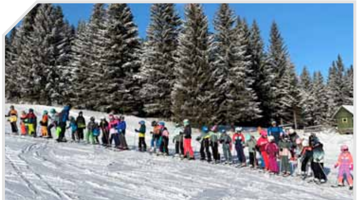
Viele Kinder waren bei den Schitagen bei den Klugliften dabei.