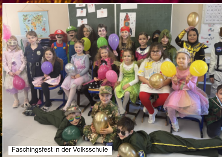
Faschingsfest in der Volksschule