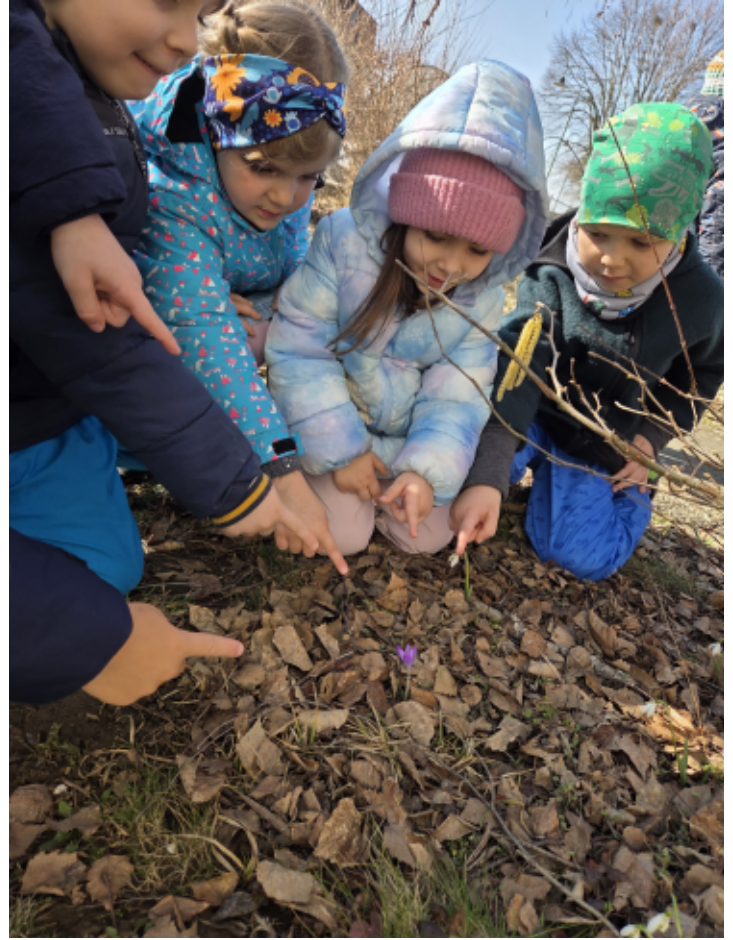
Frühlingsbeginn: Die ersten Blumen brechen durch die Laubdecke