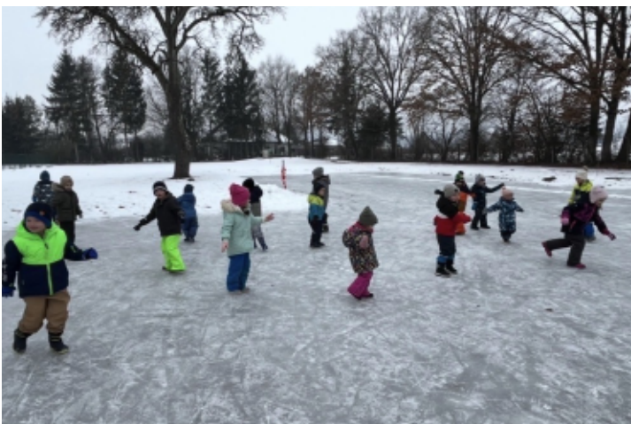
Spass auf dem Eis