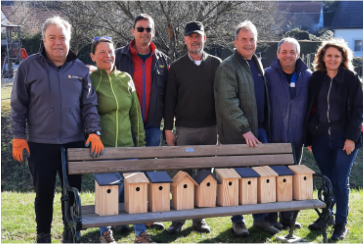
Flurreinigung Zahling und Vogelnester des Verschönerungsverein Zahling