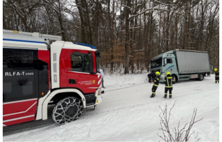
FF Eltendorf: Brandeinsatz in Eltendorf und LKW Bergung