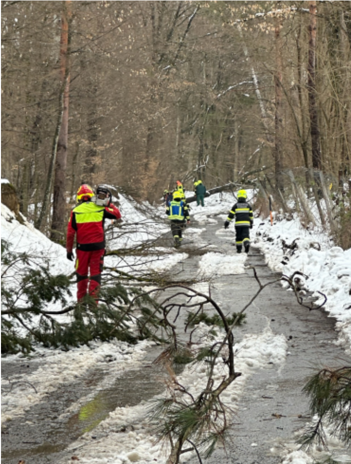
Umgestürzte Bäume und Äste