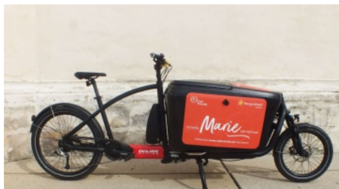
Ab Mitte April zum ausprobieren - Lastenrad "Marie"