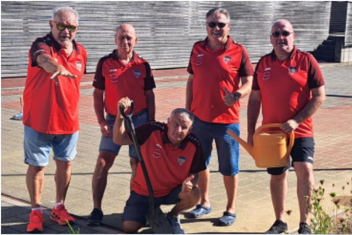
ESV: Baumpflanz-Challenge 2025