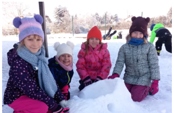
Spass im Schnee