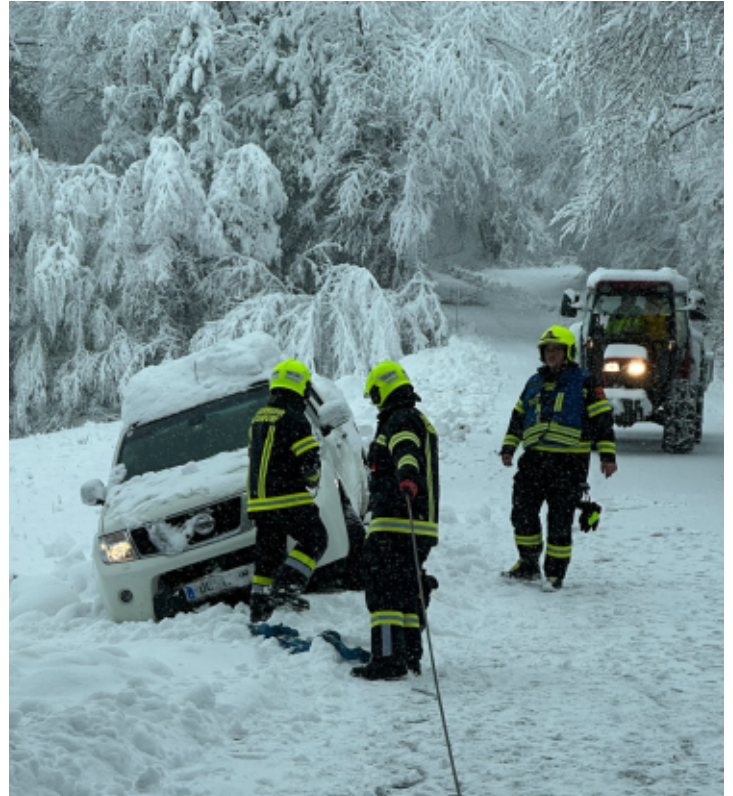
Auch Autos kamen von der Straße ab