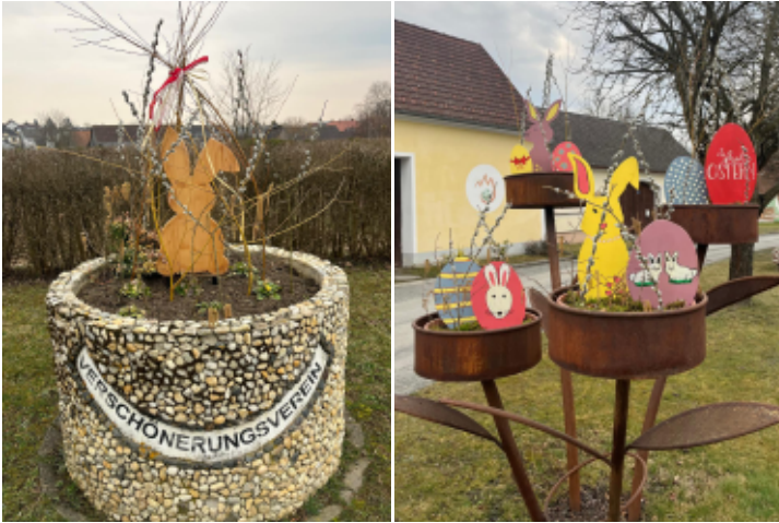
Dekoration zu Ostern