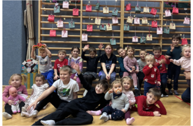
Dorfkinder: Weihnachtsspecial mit Geschenken für alle