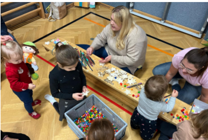
Kinder haben Spass im Turnsaal der Volksschule