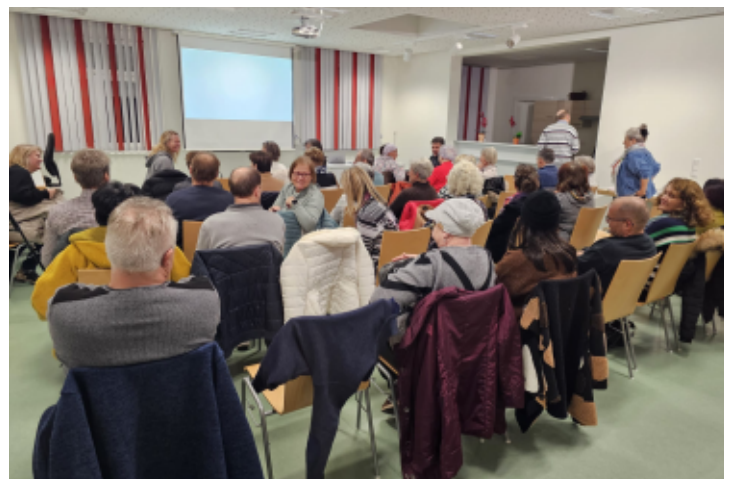
Vorträge / Diskussionen im Sitzungssaal