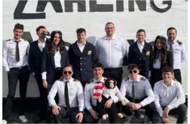
„Zahling Airways“ hebte zu Fasching ab