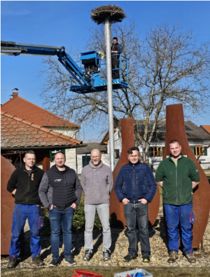
Sanierung des Storchennestes vor dem Gemeindeamt