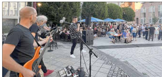
Impressionen vom After-Work-Event im vergangenen Jahr.

Gemeinsam die Stadt beleben und Netzwerke knüpfen: Die Initiative „Citymood“ der Wirtschaftsförderung Idar-Oberstein lädt am Donnerstag, 07.05.2026, ab 17:00 Uhr zum großen Auftakt der diesjährigen After-Work-Reihe auf den Schleiferplatz ein. Das Besondere in diesem Jahr: Erstmals findet die Veranstaltung in enger Kooperation mit der WFG BIR mbH, der Wirtschaftsförderungs- und Projektentwicklungsgesellschaft Landkreis Birkenfeld mbH, statt. Die weiteren After-Work-Termine werden anschließend in Kooperation mit dem Stadtmarketing Verein Idar-Oberstein organisiert. Wie bereits in den vergangenen zwei Jahren sind Familien, Freunde sowie Kolleginnen und Kollegen herzlich eingeladen, den Weg nach Idar-Oberstein zu finden, um gemeinsam einen entspannten Abend zu verbringen, zu feiern und sich auszutauschen.