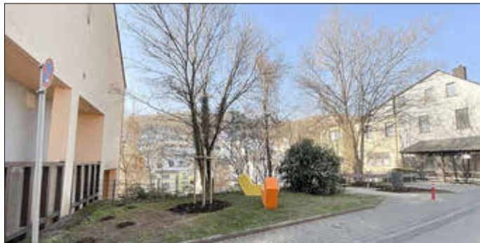
Die neu gestaltete Grünfläche in der Wasenstraße 41 wurde auch mit Sitzmöglichkeiten versehen.

Passend zum Frühling erblühen die städtischen Grünflächen im Quartier Wasenstraße in neuem Glanz. Den Auftakt bildete die Anlage an der Alfred-Peth-Brücke: Durch das Entfernen der bodendeckenden Bepflanzung wirkt der Bereich nun offener und freundlicher.