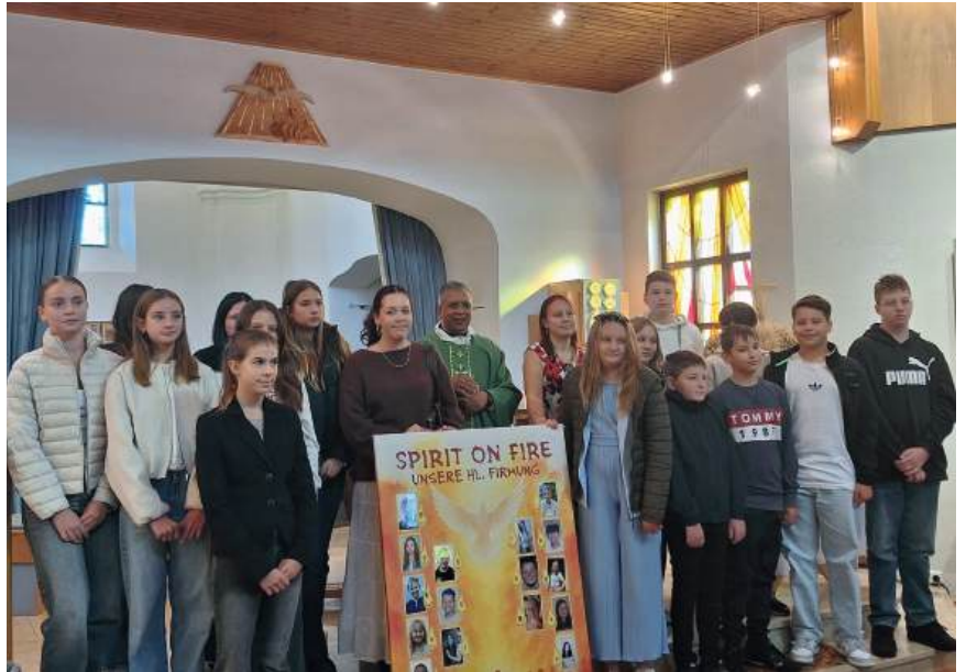
Firmlinge aus Ollersdorf bei der Vorstellung in der Pfarrgemeinde

In der weiteren Vorbereitungszeit stehen bis zur feierlichen Firmung am 21. Juni 2026 in Stegersbach und am 27. Juni 2026 in Ollersdorf noch die Mitgestaltung von Gottesdiensten, ein Treffen mit Jugendlichen aus Cenacolo sowie im Zuge der Beichte ein gemeinsamer Tagesausflug nach Niederösterreich zum Stift Heiligenkreuz auf dem Programm.