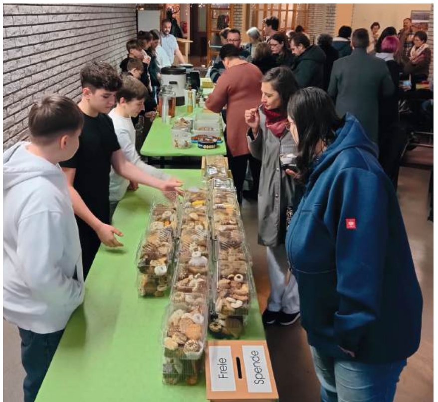
Firmlinge aus Stegersbach beim Einsatz im Rahmen der Firmvorbereitung