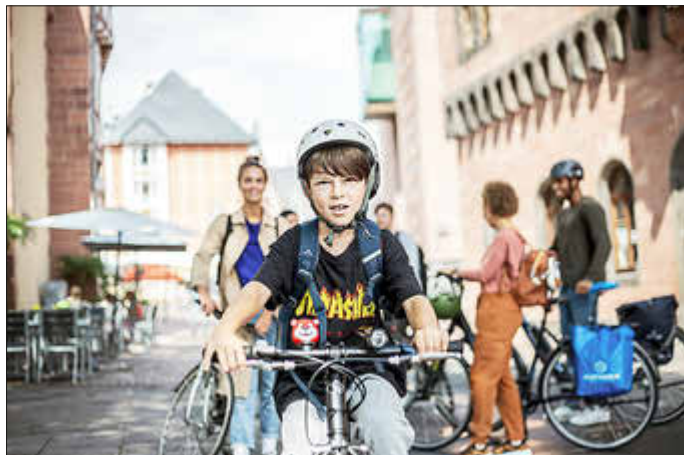
Idar-Oberstein beteiligt sich in diesem Jahr wieder am STADTRADELN.

Mit der Aktion tun sie auch etwas für das Klima und machen in dieser Zeit den Radverkehr im Stadtgebiet noch sichtbarer.