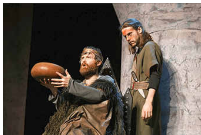
Macbeth möchte den Thron von König Duncan besteigen.

Im Rahmen des THEATERSOMMER Idar-Oberstein präsentiert die American Drama Group Europe (ADG) am Dienstag, 16.06.2026, um 19:00 Uhr auf Schloss Oberstein William Shakespeares berühmte Tragödie „Macbeth“. Das in englischer Sprache aufgeführte Theaterstück beleuchtet den Verfall der Macht und dessen erschreckende Folgen, sowohl in politischer als auch in persönlicher Hinsicht.