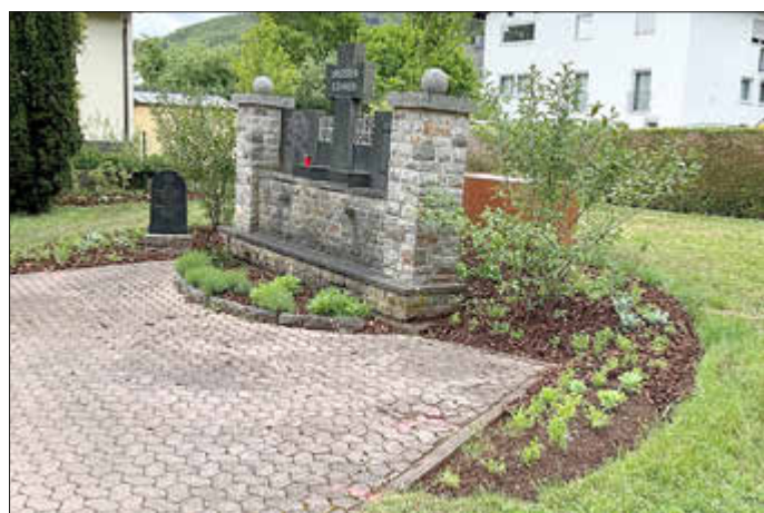
Auf dem Friedhof Georg-Weierbach wurde ein neuer Ruhe-Park errichtet.

Der Friedhof im Stadtteil Georg-Weierbach hat ein neues, würdevolles Herzstück erhalten. Der neue Ruhe-Park ist offiziell fertiggestellt worden. Die Anlage verbindet moderne Gestaltungselemente mit einer naturnahen Bepflanzung und bietet Platz für insgesamt 24 neue Grabstätten, diese können nach einem Sterbefall erworben werden. Der Baubetriebshof hat die Umgestaltung umgesetzt.