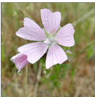
Moschus-Malve auf der Streuobstwiese