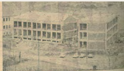
Bis zur Dachgleiche ist der Hauptschulbau in Neuhaus am Klausenbach gediehen. Die neunklassige Hauptschule, die samt Nebengebäude und Turnsaal über 13 Millionen Schilling kostet, wird, soll bis zum Schuljahr 1975/76 fertiggestellt sein. Mit der Errichtung dieses neunklassigen Schulbaues geht ein jahrelanger Wunsch der Bevölkerung des Neuhauser Hügellandes in Erfüllung. Zur Zeit wird in verschiedenen Nebengebäuden unterrichtet.