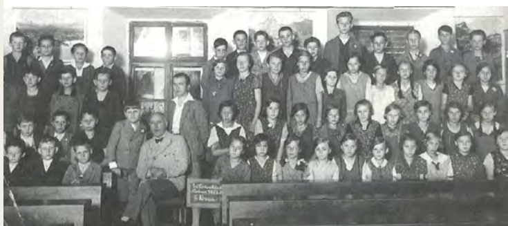
Zwei Klassen der konfessionellen Volksschulen in den 1930er-Jahren: oben eine evangelische aus dem Schuljahr 1933/34, unten eine katholische aus dem Schuljahr 1937/38.

Was einstmals im vorigen und vorvorigen Jahrhundert mit den konfessionellen Schulen in unserer Heimat begann und schon damals galt, gilt auch heute noch: „Zur Schule gehen“, einmal auch im wörtlichen Sinne, ist wichtig und unerlässlich, denn Bildung ist Voraussetzung für eine funktionierende Gesellschaft, für das Berufsleben im Erwachsenenalter – Grundlage für einen bestimmten Lebensstandard und persönlichen Wohlstand. Dabei den Bildungsweg mit dem Besuch der Grundschule(n) in der unmittelbaren Heimat starten zu dürfen, ist bestimmt ein willkommener Umstand für alle Beteiligten. Hoffen wir, dass dies noch länger so bleibt und sich das „zur Schule gehen“ für viele Kinder – so wie bestimmt auch für die meisten von uns – später einmal als ein sehr schöner Lebensabschnitt darstellt, an den man sich gerne zurückerinnert.