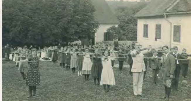
Turnstunde der evangelischen Schule am Hauptplatz, 1925

weiligen Pfarrgemeinderat ausgewählt und bestellt. Die Entlohnung erfolgte durch die Pfarrgemeinde (wofür der Lehrer zusätzlich dann oft auch Kantor- und Küsterdienste verrichten musste), aber auch durch die politische Gemeinde durch Einhebung von Beiträgen von den Eltern der Schüler, auch in Naturalienform und/oder dem Zurverfügungstellen einer Wohnung. Ab 1910 bzw. 1912 wurde von der katholischen Pfarrgemeinde auch konfessionelle Schulen in Kalch und Bonisdorf, vorerst provisorisch in Privathäusern untergebracht, betrieben. Gleichzeitig wurde mit dem Bau eigener Schulgebäude, wiederum mit tatkräftiger Hilfe der Gemeinden bzw. der Bevölkerung, begonnen, um bereits ab Herbst 1913 auch darin unterrichten zu können – den heutigen zu Wohnhäusern umgebauten Objekten Kalch Nr. 88 und Bonisdorf Nr. 43.