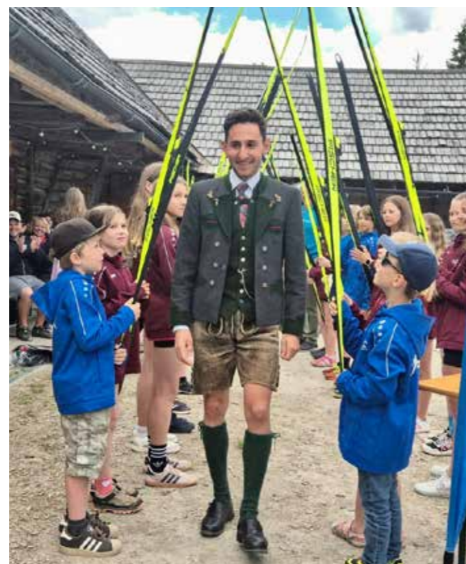
... bei den Neuhofner Stallungen.