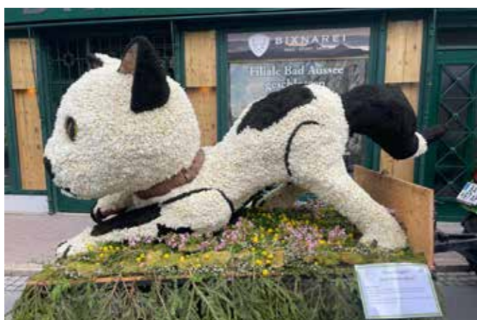
Kogler Katze erreichte den 1. Platz in der Kategorie „alte Gestelle“.