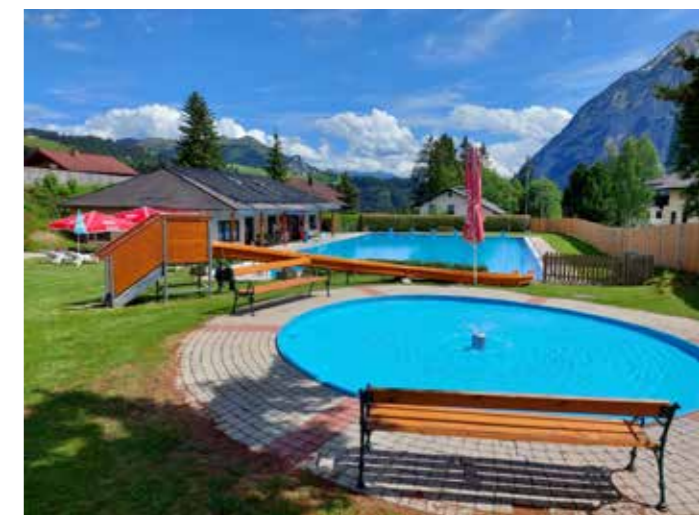
Das Tauplitzer Schwimmbad.