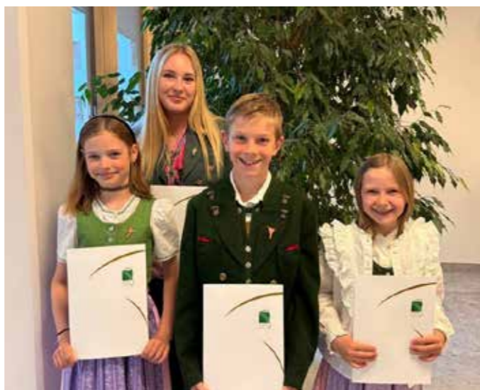
Gratulation dem talentierten Nachwuchs.