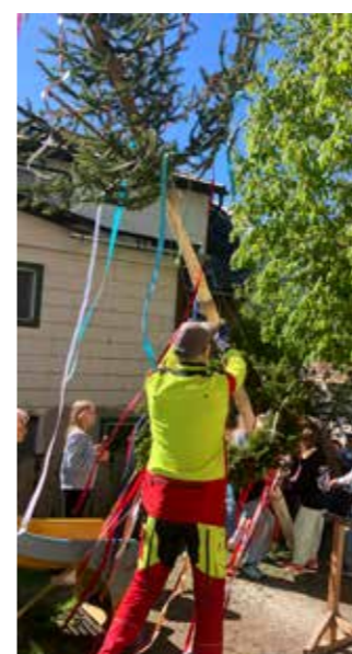
Mit vereinten Kräften...