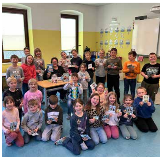
Viel Spaß bei der Lesung in VS Knoppen.