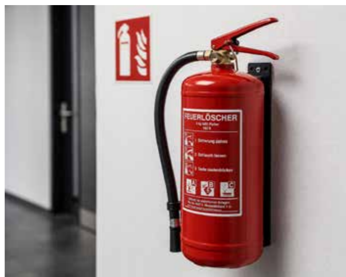
Symbolfoto, KI generiert

Die Feuerbeschau dient nicht der Bestrafung, sondern