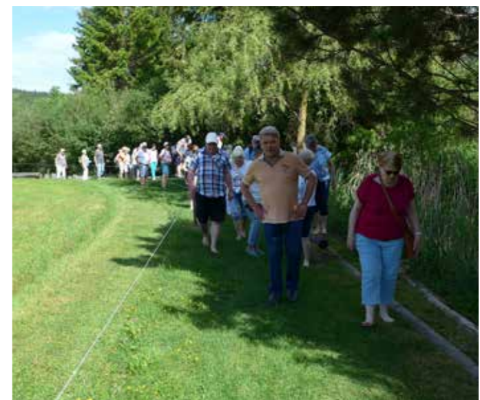
Zahlreiche Besucher erfreuten sich schon an der Anlage.