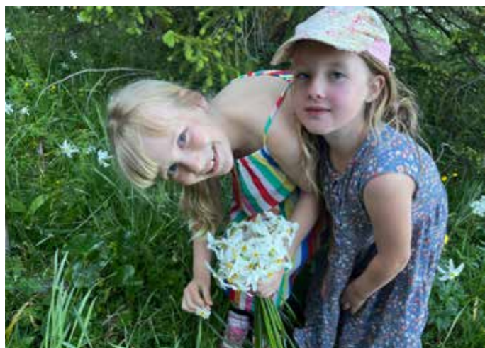
Groß und Klein haben fürs Hotel Kogler Narzissen gepflückt.

Hier ein paar Fotos von der Steirischen Roas. An dieser Stelle nochmal ein herzliches Danke an alle Teilnehmer*innen und Helfer*innen für das große Engagement! Ein Dank gilt auch an Alle, die Plätze, Strom und andere Dinge zur Verfügung gestellt haben. Es war ein wunderbarer Tag, der ohne euch nicht so hätte stattfinden können.