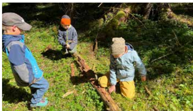
Viel gibt's beim Waldtag zu entdecken.