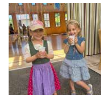
Die Kleinen hatten sichtlich Spaß.