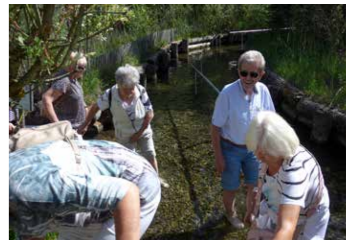
Kneippen erfrischt nicht nur die Füße.