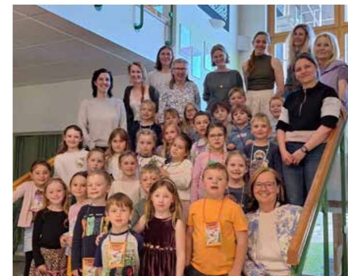
Voller Neugier auf die Schule.

Da diese aus 4 verschiedenen Kindergartengruppen kommen, ist es nicht immer selbstverständlich, dass jeder jeden kennt. So eignet sich dieser Nachmittag gut für ein Kennenlernen der Kinder untereinander, aber auch der Lehrerinnen. Von 14:00 Uhr bis 15:30 Uhr durchlaufen die Kinder verschiedene Stationen, zu denen natürlich auch eine Jause gehört. Weiters hatten die Schulanfänger*innen die Möglichkeit 2 Stunden am Vormittag in der Schule zu verbringen und Unterrichtsluft zu schnuppern. Am Abend fand für die Eltern der 1. Elternabend mit wichtigen Informationen für einen gelingenden Schulstart statt. Sowohl am Nachmittag als auch Vormittag hatten die Kinder viel Spaß.