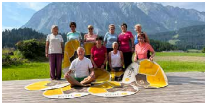
Begeisterte Teilnehmer bei KortX.