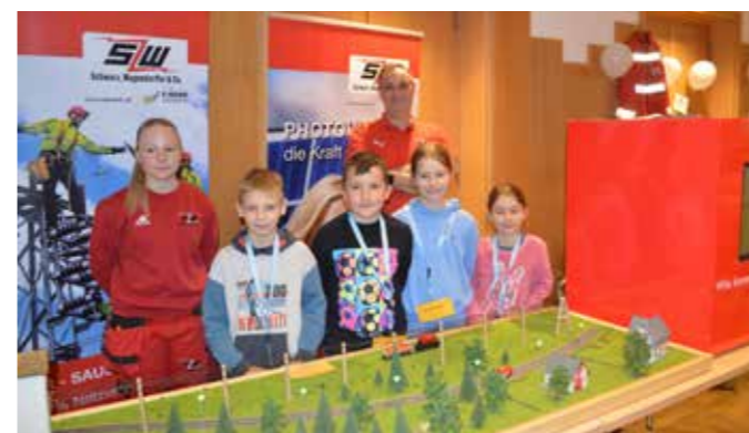
Interessantes beim E-Werk.