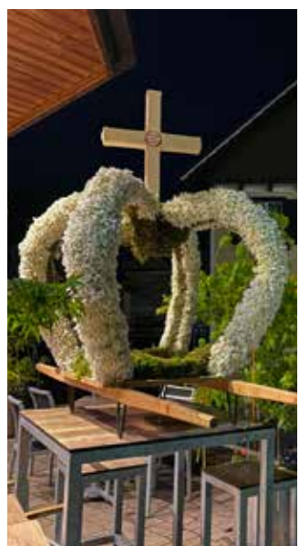
... fürs Stecken der Erntekrone.