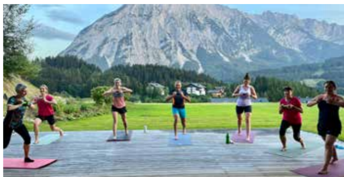
Turnen vor herrlicher Kulisse.