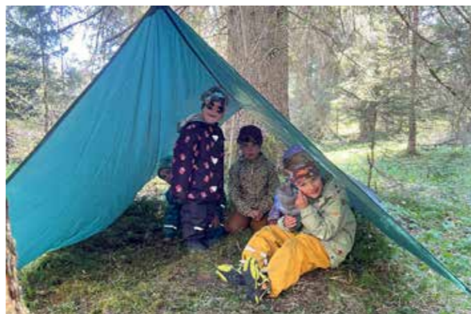
Abenteuerlich unterwegs im Wald.