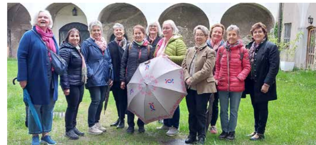
Das Team Ausseerland-Hinterberg.

Es sind dies Idealisten und außergewöhnliche Persönlichkeiten aus dem Ausseerland,