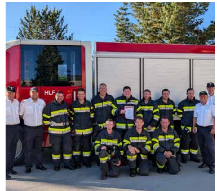
Die erfolgreiche Truppe.