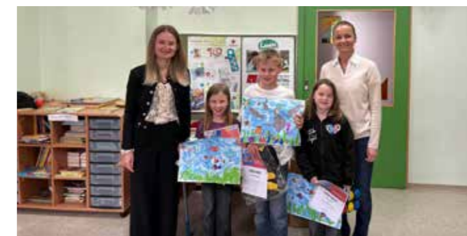
Stolz auf ihre Kunstwerke...

Beim Thema „Meer entdecken“ konnten die Kinder ihrer Fantasie freien Lauf lassen. Die Ergebnisse sprechen für sich. Platz 1 – 3 erhielt wieder tolle Preise und alle anderen bekamen einen kleinen Trostpreis als Dankeschön fürs Mitmachen. Herzlichen Glückwunsch an alle Kinder für die tollen Zeichnungen.