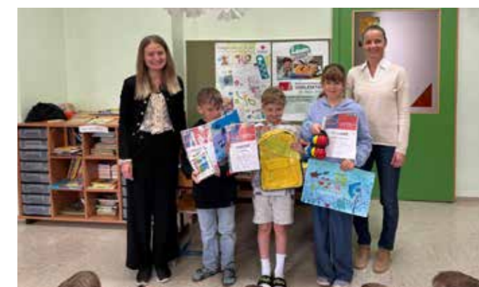
... sind die Kids der VS Taupplitz.