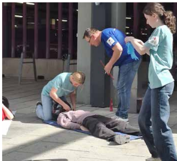
Sicheres Auftreten in Notfallsituationen war gefragt.