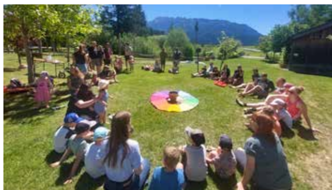
Gemeinsam wurde ein schöner Tag verbracht.