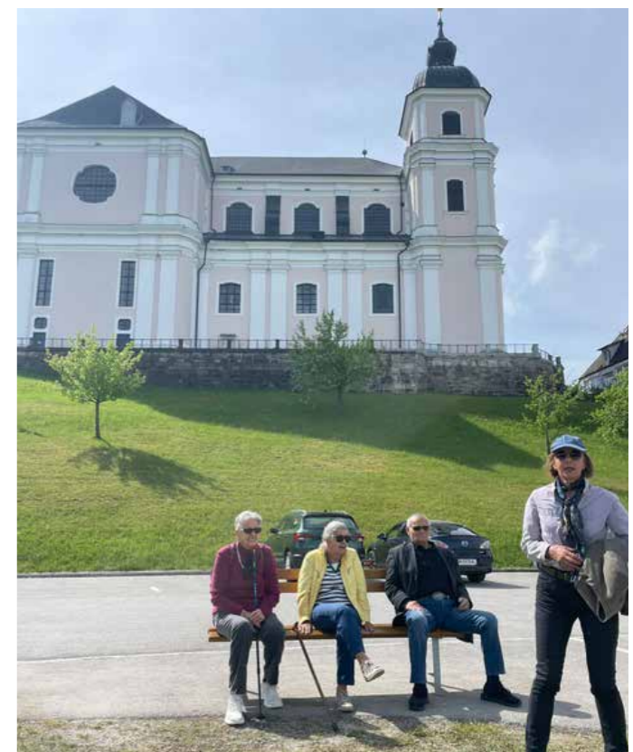
Am Sonntagberg in Waidhofen an der Ybbs.

Nach vielen sehr schönen Eindrücken ging die Fahrt weiter über den Seeberg Richtung Kalwang, wo wir im Gasthof Viertler mit einer guten Jause verwöhnt wurden, bevor es anschließend wieder zurück nach Bad Mitterndorf ging und ein wunderschöner Tag sein Ende nahm.