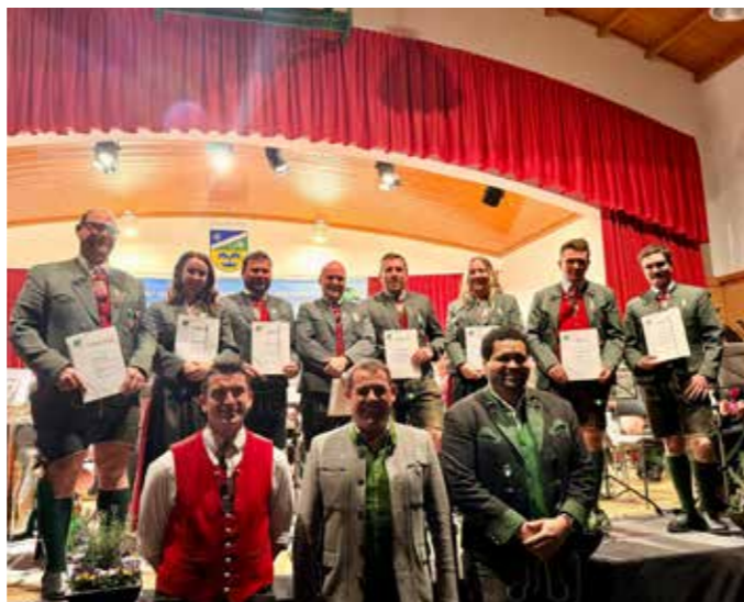
Ehre, wem Ehre gebührt. Auszeichnungen beim Wunschkonzert.

Am Pfingstsonntag fand die Steirische Roas in Tauplitz statt. Auch wir durften diese musikalisch und kulinarisch begleiten. So umrahmte die Trachtenkapelle Tauplitz den Live-Frühshoppen des Radio Steiermark und unsere Renner Musi sowie die Stupsara Tanzmusi spielten bei den diversen Stationen auf. Vielen Dank an alle Helfer und „Einkehrer“ für euren Besuch in unserem Musikheim. Die Trachtenkapelle Tauplitz freut sich schon auf einen ereignisreichen Sommer. Das erste Platzkonzert findet am Donnerstag, 09.07.2026 am Dorfplatz in Tauplitz statt.