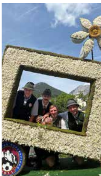
Dann kann man sich beim Fest entspannen.