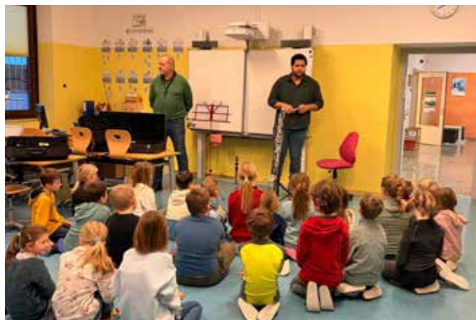
Die Kids zeigten Begeisterung für kleine ...

Die Musikkapelle Kumitz besuchte die Schüler*innen im Jänner und Februar an mehreren Terminen und stellte dabei jeweils ein Instrumentenregister vor. Den Kindern wurde gezeigt, dass die vorgestellten Instrumente nicht nur in der Blasmusik zum Einsatz kommen, sondern auch in vielen anderen Musikgenres verwendet werden. Die Vertreter*innen der Musikkapelle nahmen sich viel Zeit, um die Fragen der Kinder zu beantworten. Im Anschluss hatten die Schüler*innen die Möglichkeit, die Instrumente selbst auszuprobieren.