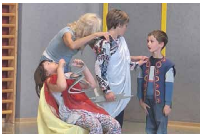
... bei der mitreißenden Aufführung.