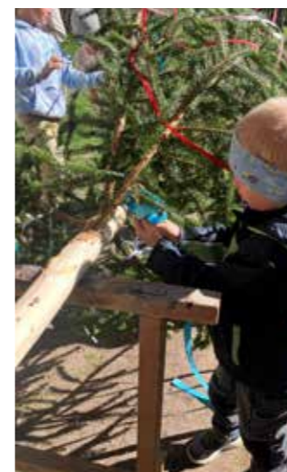
... und anschließendem Schmücken.