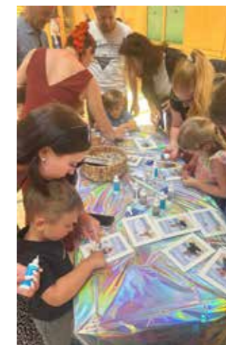
Beim gemeinsamen Basten.