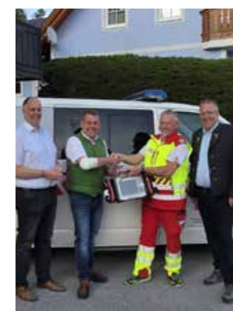
Bei der Übergabe ...

Der Corpuls C3 verfügt unter anderem über eine Monitorfunktion, Defibrillator- und Schrittmacherfunktion, Telemedizin-Anbindung sowie verschiedene Messsysteme zur Überwachung von Patientinnen und Patienten. Damit steht den Einsatzkräften modernste Medizintechnik für den Ernstfall zur Verfügung. Mit dieser Investition leistet die Marktgemeinde Bad Mitterndorf einen wichtigen Beitrag zur bestmög-