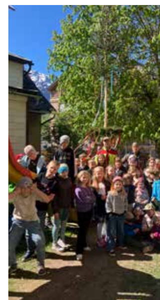
... bis der Maibaum steht.