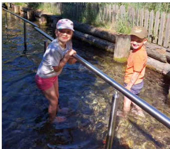
Spaß beim Familientag.

Dieses Jahr feierte der Kindergarten Pichl-Kainisch sein Familienfest an einem ganz besonders schönen Platz: dem Barfußpark in Neuhofen. Eröffnet wurde das Fest mit einem stimmungsvollen Tanz, an dem sich alle gemeinsam entweder als Tänzer oder als Musiker beteiligen konnten. Über den Vormittag hinweg wurde der gesamte Park mit großer Begeisterung erkundet. Das Kneippbecken, der Barfußweg und das Moorbecken im Wald waren dabei besondere Highlights. Auch beim liebevoll angelegten Baumlehrpfad konnten die Familien die keltischen Horoskope der Kinder entdecken und wunderschöne Naturbilder gestalten. Zum Abschluss kamen wir noch einmal zu einem großen Kreis zusammen. Mit einem kleinen Ringelblumensamen war jeder eingeladen, in sich zu gehen und zu überlegen, wofür er an diesem Tag dankbar war. Die Samen wurden anschließend in einen Topf gepflanzt, welcher als Dankeschön für diesen schönen Naturplatz beim Baumwipfelpfad ein neues Zuhause fand