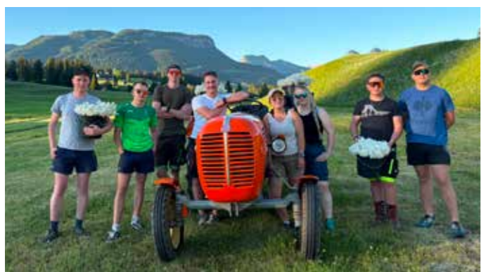
Die Landjugend Bad Mitterndorf sammelte Narzissen ...