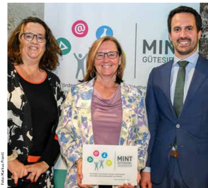
Die stolze Direktorin bei der Verleihungsgala.

Das Gütesiegel ist eine gemeinsame Initiative des Bildungsministeriums, der Industriellenvereinigung und der Pädagogischen Hochschule Wien. Es stellt eine bundesweit gültige Auszeichnung für innovatives Lernen in Mathematik, Informatik, Naturwissenschaften und Technik (MINT) mit vielfältigen Zugängen für Mädchen und Burschen dar. Die Verleihung des Gütesiegels ist Teil der umfassenden nationalen Bemühungen, MINT-Bildung in allen Bildungsstufen voranzutreiben und die Weichen für Chancengerechtigkeit und Innovation zu stellen. Das Gütesiegel wird für die Dauer von drei Jahren vergeben, eine Wiedereinreichung ist nach einer Phase der Qualitätsentwicklung möglich.