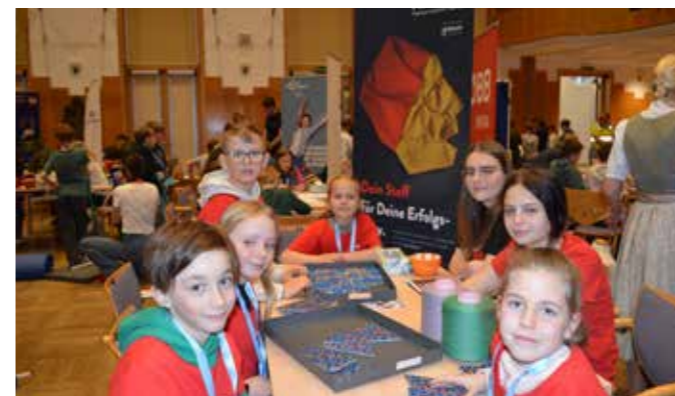
Spannende Einblicke bei der Firma Kneitz.

Am 15. und 16. April 2026 verwandelte sich das Congresshaus Bad Aussee in eine große Erlebniswelt rund um Beruf und Ausbildung. 23 Unternehmen und Institutionen aus dem Bezirk vermittelten praxisnahe Eindrücke und zeigten die vielfältigen Möglichkeiten in der Region auf. Die Initiative wird vom RML Regionalmanagement Bezirk Liezen, der Steirischen Volkswirtschaftlichen Gesellschaft und der Steiermärkischen Sparkasse organisiert und durch Mittel des Landes Steiermark unterstützt.