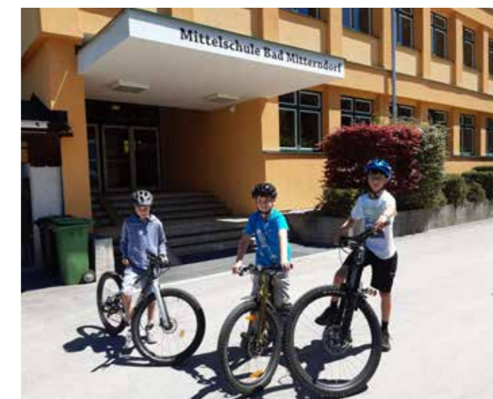
Fleißig am Radeln.

Ziel ist es, die Kinder zu mehr Bewegung zu motivieren und dabei auch die Umwelt zu schonen. Unterstützt von der Plattform "Bikeline", werden die Fahrten der Schüler*innen erfasst, Challenges gestartet sowie Preise verlost. Am Ende der eineinhalb monatigen Challenge werden die fleißigsten Radler gekürt. Ein weiteres Projekt der Mittelschule, um für mehr Bewegung im Alltag zu sorgen.