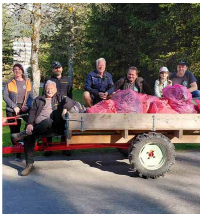
Die engagierten Mitglieder der Berg- und Naturwacht.

Die Berg- und Naturwacht Bad Mitterndorf setzt sich für den Erhalt dieser wertvollen Naturräume ein. Ob bei der Beseitigung von Müll oder beim Schutz sensibler Lebensräume, jeder Beitrag hilft, die Natur für kommende Generationen zu bewahren.