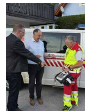
... wurde das Gerät auch gleich getestet.

chen Versorgung der Bevölkerung und stärkt gleichzei-