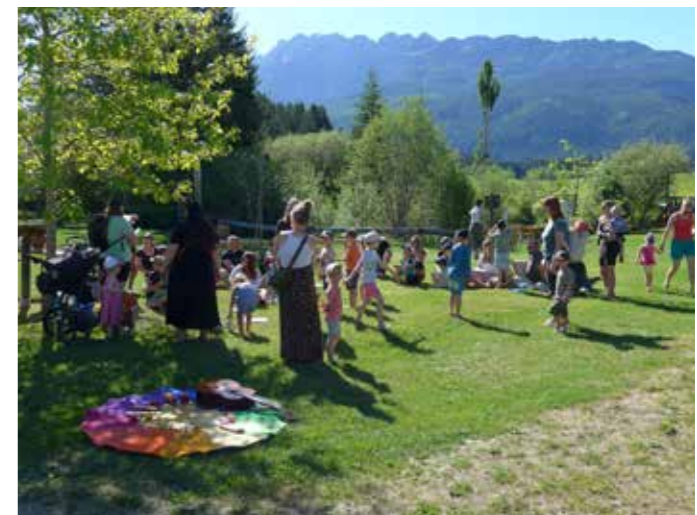
Auch junge Besucher schätzen den Barfußpark.