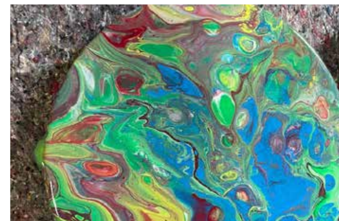
Kunstwerk vom Acrylic-Pouring Kurs.