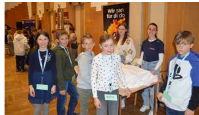
Auch Sozialberufe wurden präsentiert.