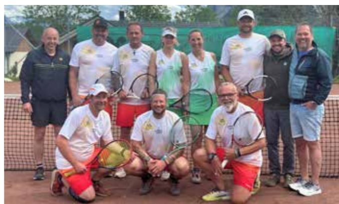
Die Freude über die neuen Dressen ist groß (nicht alle Mitglieder am Foto).

Trawenghütte Tauplitzalm sowie Hotel Der Hechl für die großzügige Unterstützung. Die neue Teambekleidung wurde bei Mike's Tennisshop in Bad Mitterndorf angeschafft. Mit den neuen Dressen sind die besten Voraussetzungen für eine erfolgreiche Saison geschaffen. Die Gemeinde Bad Mitterndorf wünscht viel Erfolg und viele Gründe zum Jubeln.