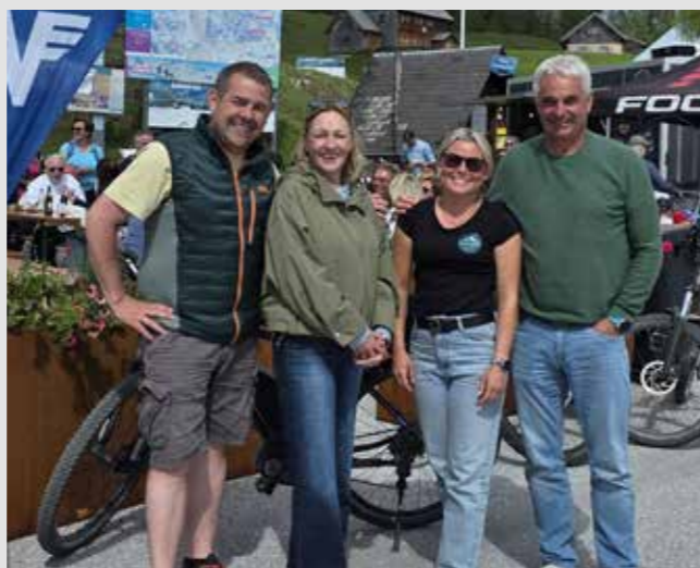
... in den „Almsommer“ auf der Tauplitz.