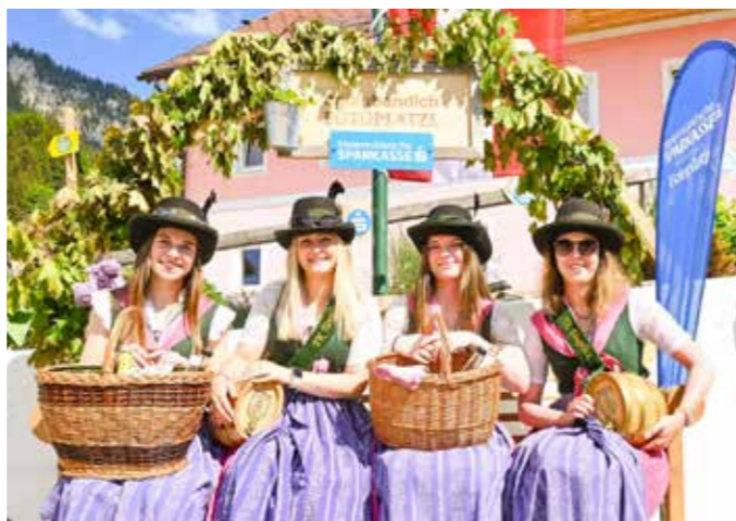
Gute Laune und viel Schnaps bei der Steirischen Roas.