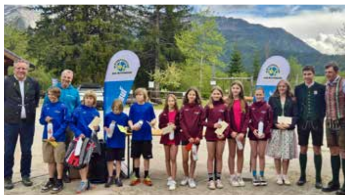
Bei der Sportlehreung ...