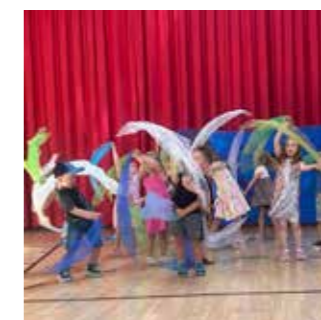
Cooler Tanzinlage bei der Geschichte vom kleinen Wal.

Unser diesjähriges Familienfest zum Thema „Unterwasserwelt“ feierten wir Ende Mai im Dorfsaal. Viele Eltern, Großeltern und Geschwister sind der Einladung gefolgt. Es wurde gesungen, getanzt und eine kurze Geschichte: „Der kleine Wal und der schönste Ort der Welt“ vorgetragen. Anschließend gab es viel Zeit für Spiel und Spaß. Jede Familie bastelte gemeinsam ein Erinnerungsgeschenk und zwischendurch konnten sich alle am reichlich gedeckten Buffet bedienen.