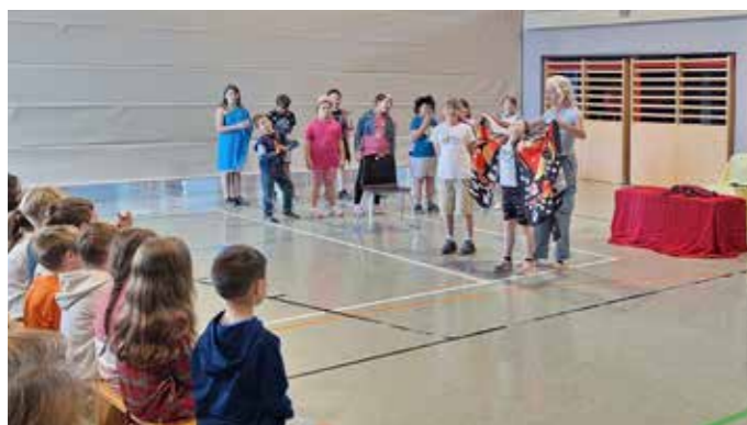
Mitten drin statt nur dabei ...

Mit dem Mozart-Ensemble Luzern wurden die Kinder wieder zu Schauspieler*innen und machten Zeus, Hera, Apollon und auch Eros lebendig. Umrahmt wurden die Darbietungen durch die wunderschönen Klänge von Jacques Offenbach, live gespielt von einer Pianistin.