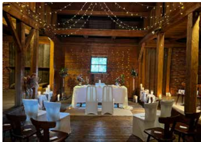
Sicheres Auftreten in Notfallsituationen war gefragt.

Der Woferl Stall ist jedoch nicht nur Bühne für geladene Gäste, sondern kann auch für den ganz persönlichen Anlass zum Leben erweckt werden. Ob für private Feiern, Hochzeiten im rustikalen Ambiente oder Workshops – der untere, bestens ausgestattete Bereich sowie die charmante, rustikale obere Etage mit integrierter Ausschank bieten Platz für bis zu 80 Personen und verleihen jedem Fest eine ganz besondere, unvergessliche Note. Kommen Sie vorbei, bringen Sie Ihre Nachbarn mit und lassen Sie uns