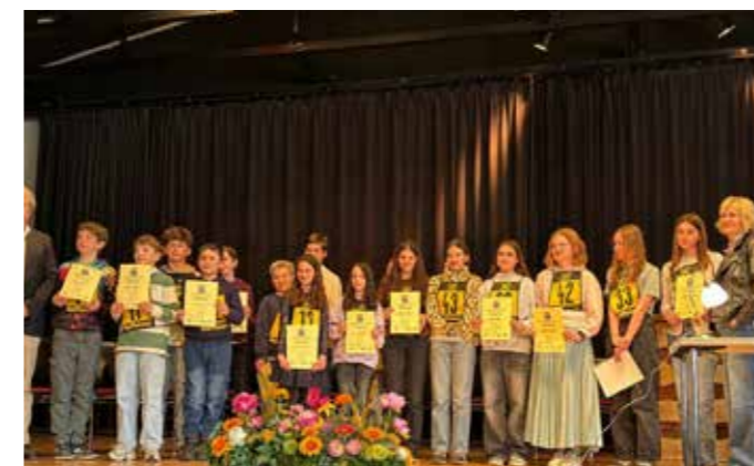
Viele Lesebegeisterte Schüler.

Unter diesem Motto findet auch dieses Jahr wieder ein Radprojekt in der Mittelschule statt.