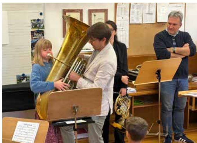
... und große Instrumente.