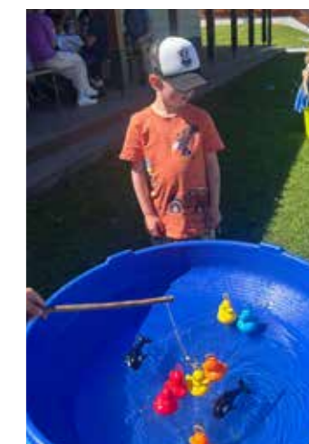
Zeit für Spiel.